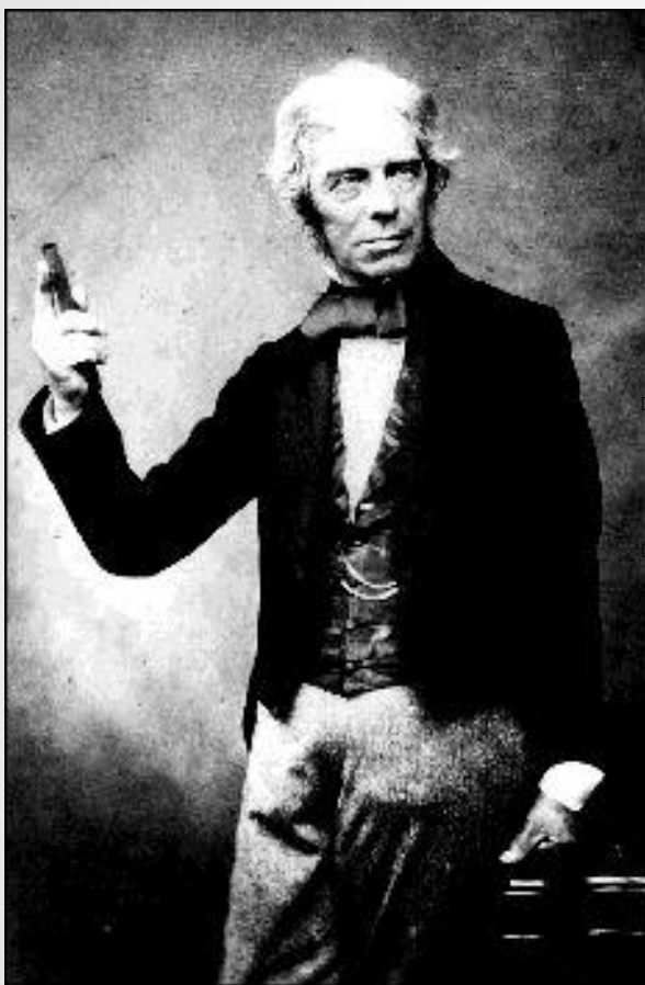
Майкл Фарадей — ввёл понятие поля

В классическом представлении различают два вида материи: вещество и поле. К первому из них относятся атомы, молекулы и все построенные из них тела, структура и форма которых весьма разнообразны. Поле - особая форма материи, иногда его называют физическим полем. К настоящему времени известно несколько разновидностей полей: электромагнитное и гравитационное поля, поле ядерных сил, а также волновые (квантовые) поля, соответствующие различным элементарным частицам. Именно для описания электромагнитных явлений выдающийся английский физик-самоучка Майкл Фарадей (1791- 1867) в 30-е годы XIX в. впервые ввел понятие поля.