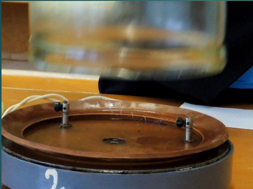
Проволока с током на воздухе