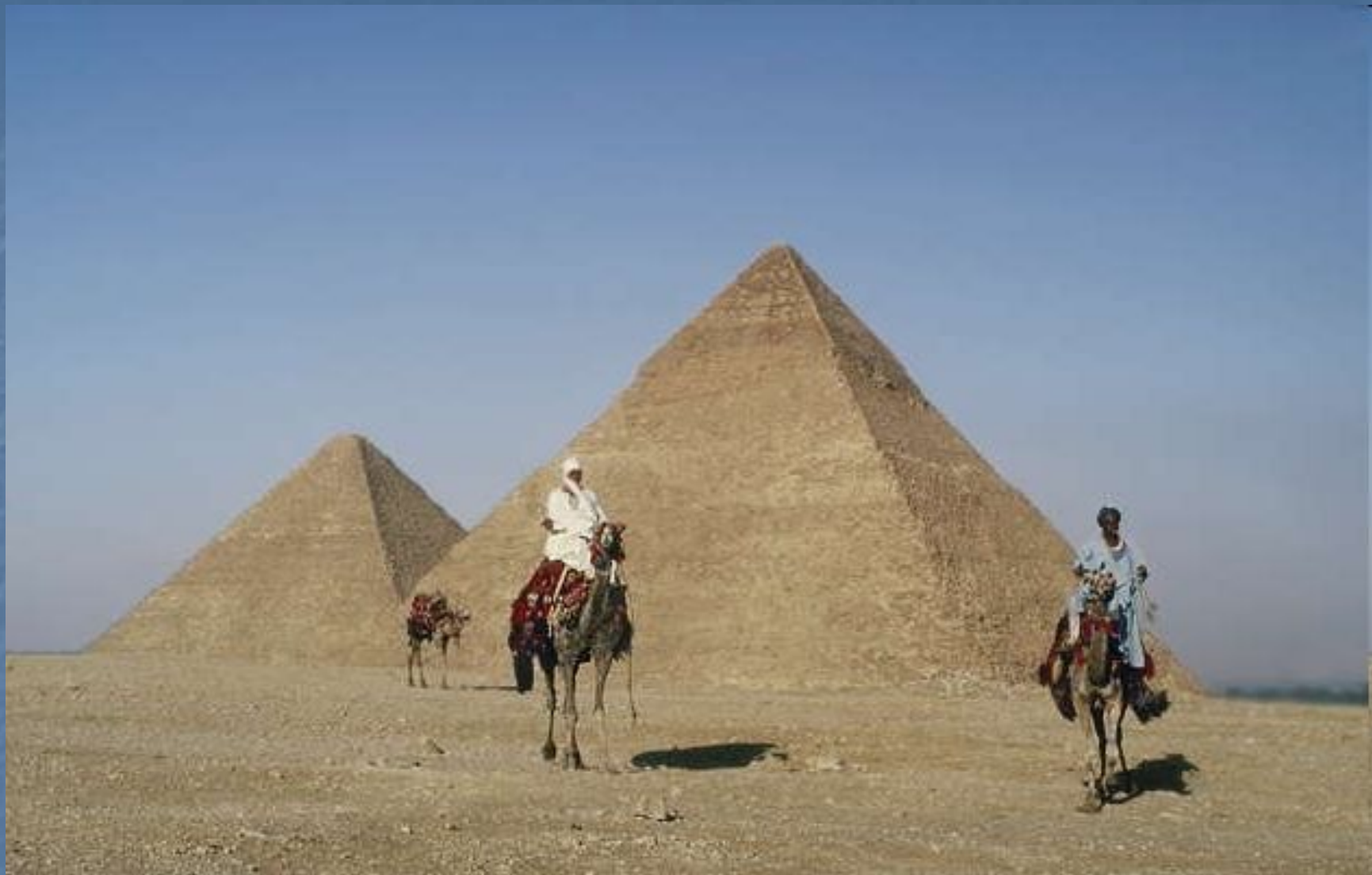
Египет. Великие пирамиды в Гизе.