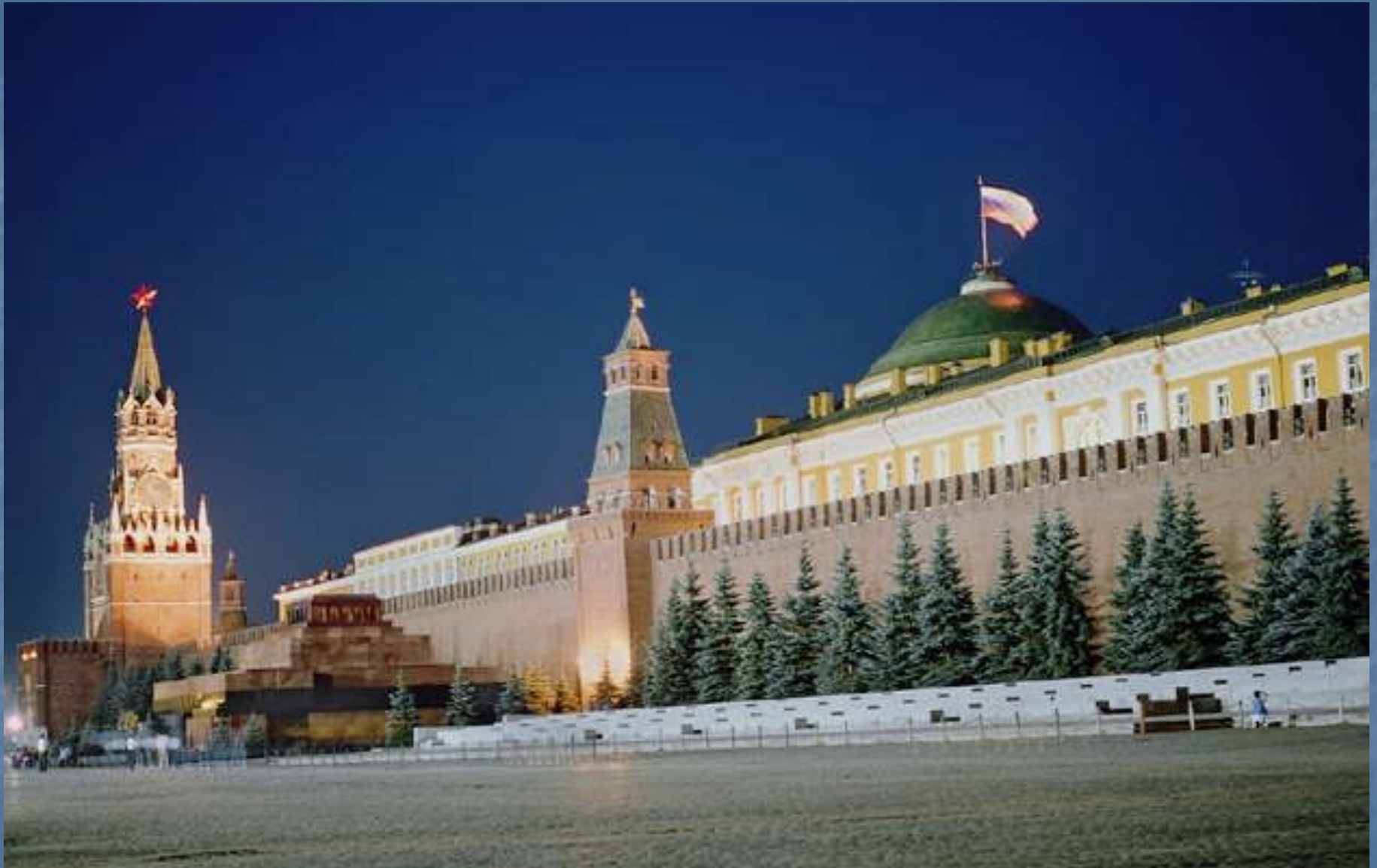
Москва. Кремль ночью.