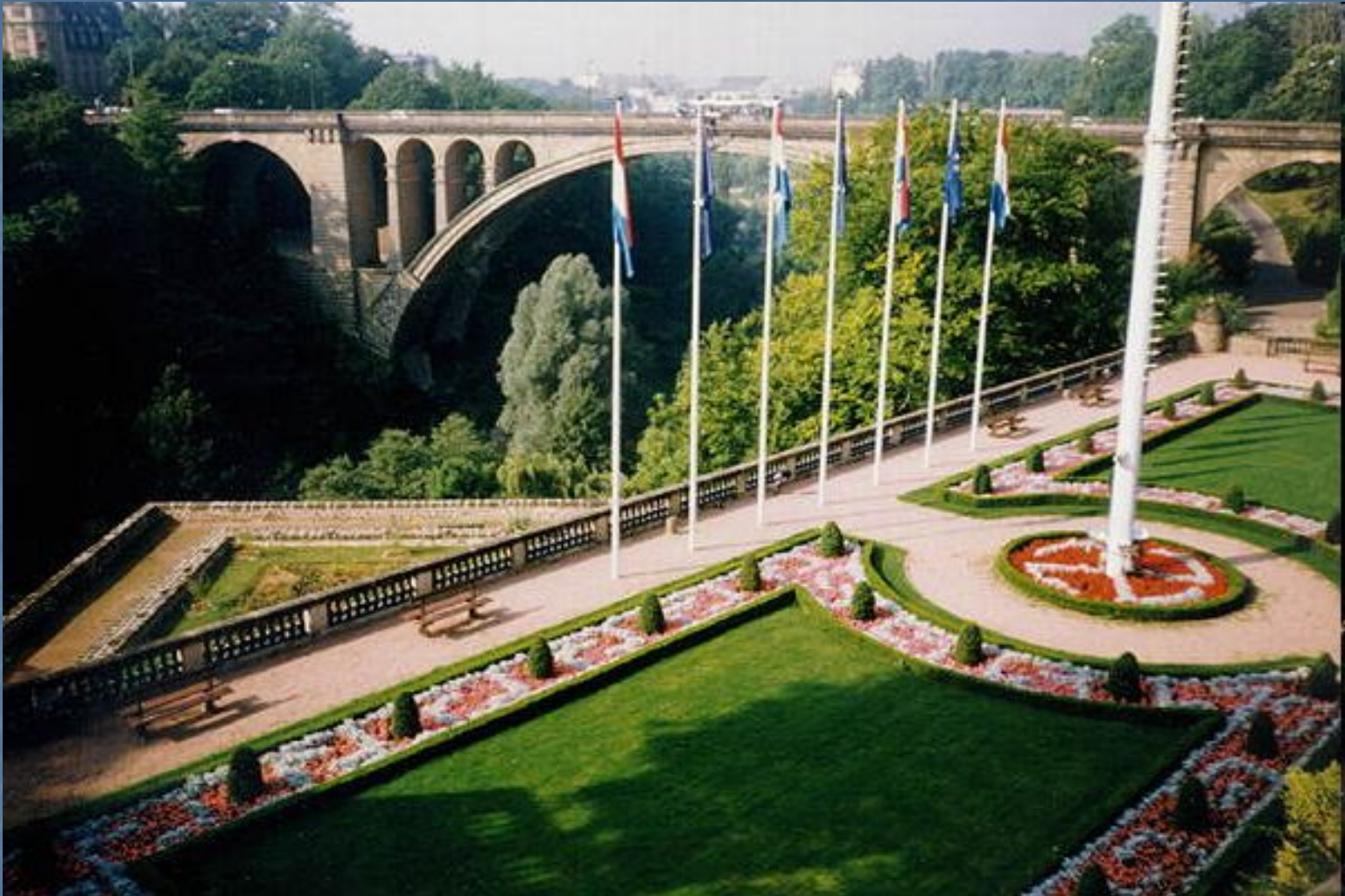
Люксембург. Висячие сады.