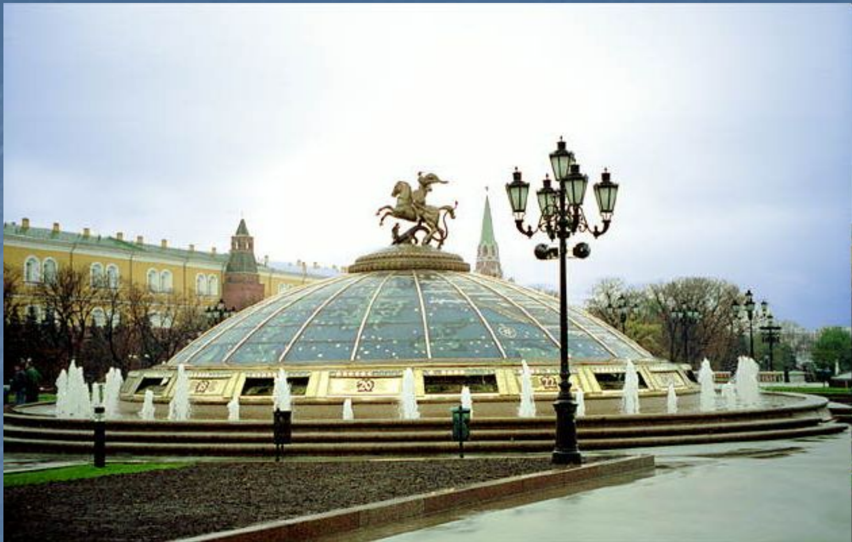
Москва. Манежная площадь, реконструированная к 850-летию города.