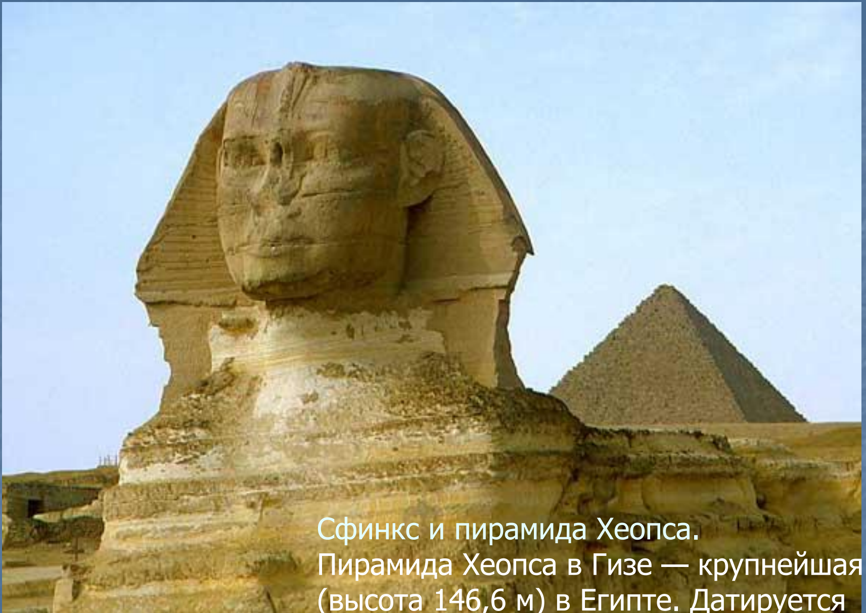
Сфинкс и пирамида Хеопса. Пирамида Хеопса в Гизе — крупнейшая (высота 146,6 м) в Египте. Датируется III тысячелетием до н. э.