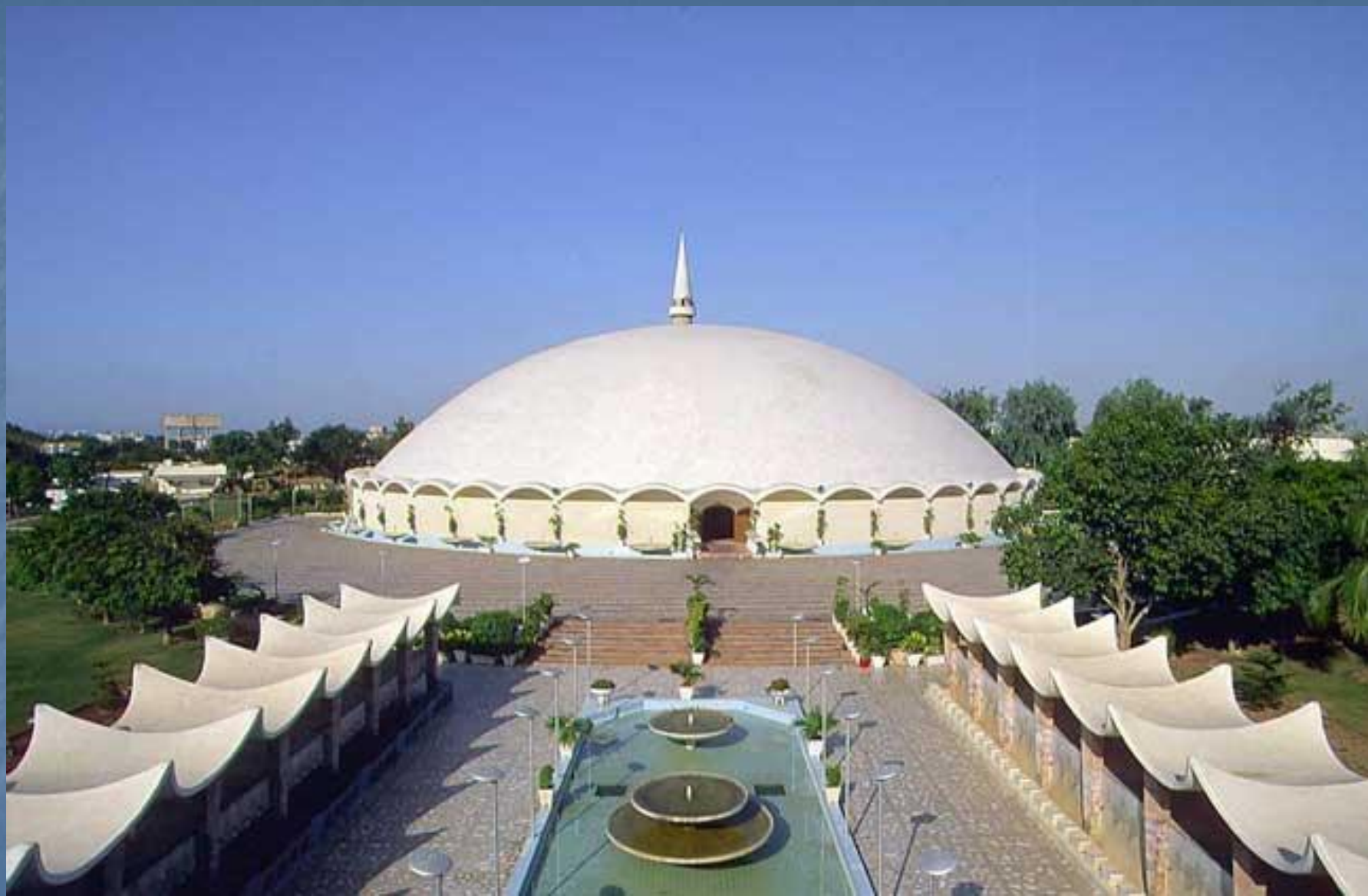
Современная мечеть в Карачи с куполообразной крышей.