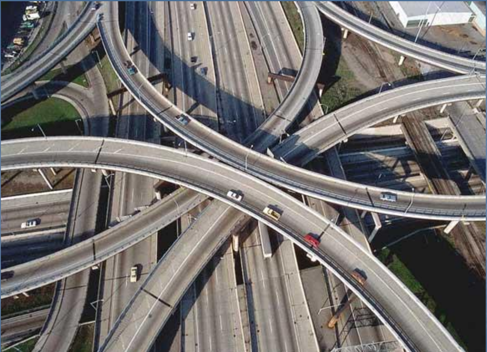
Развязки городских автомагистралей