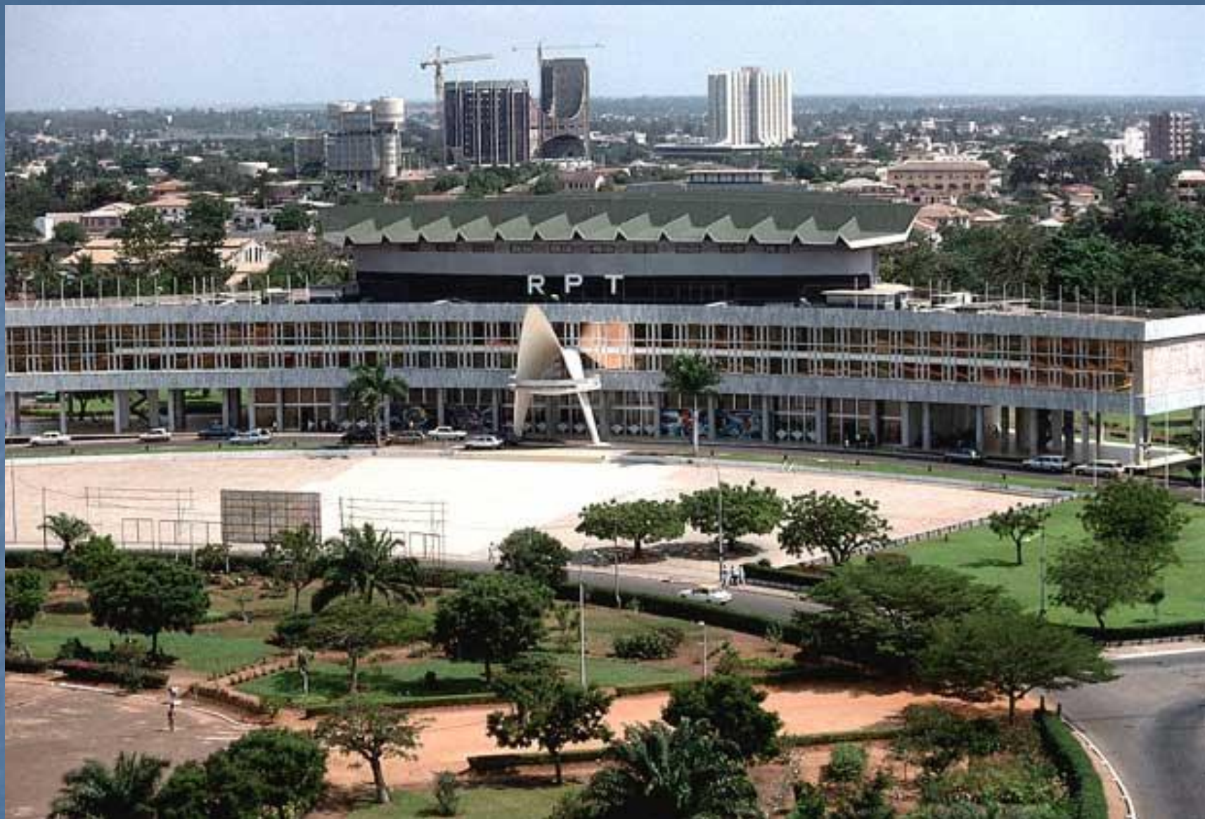
Ломе (столица Того): использование гофрированной конструкции