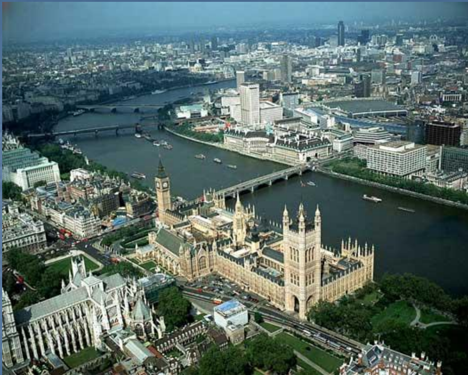
Здание парламента и башня Биг Бен (1837) в Лондоне.