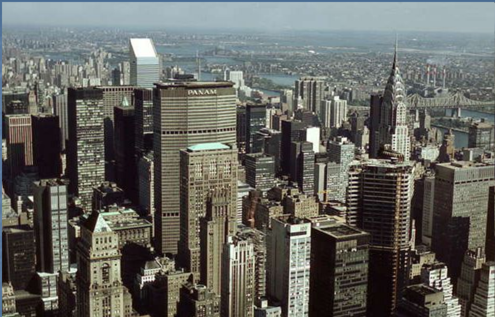
Нью-Йорк, США. Панорама центра города.