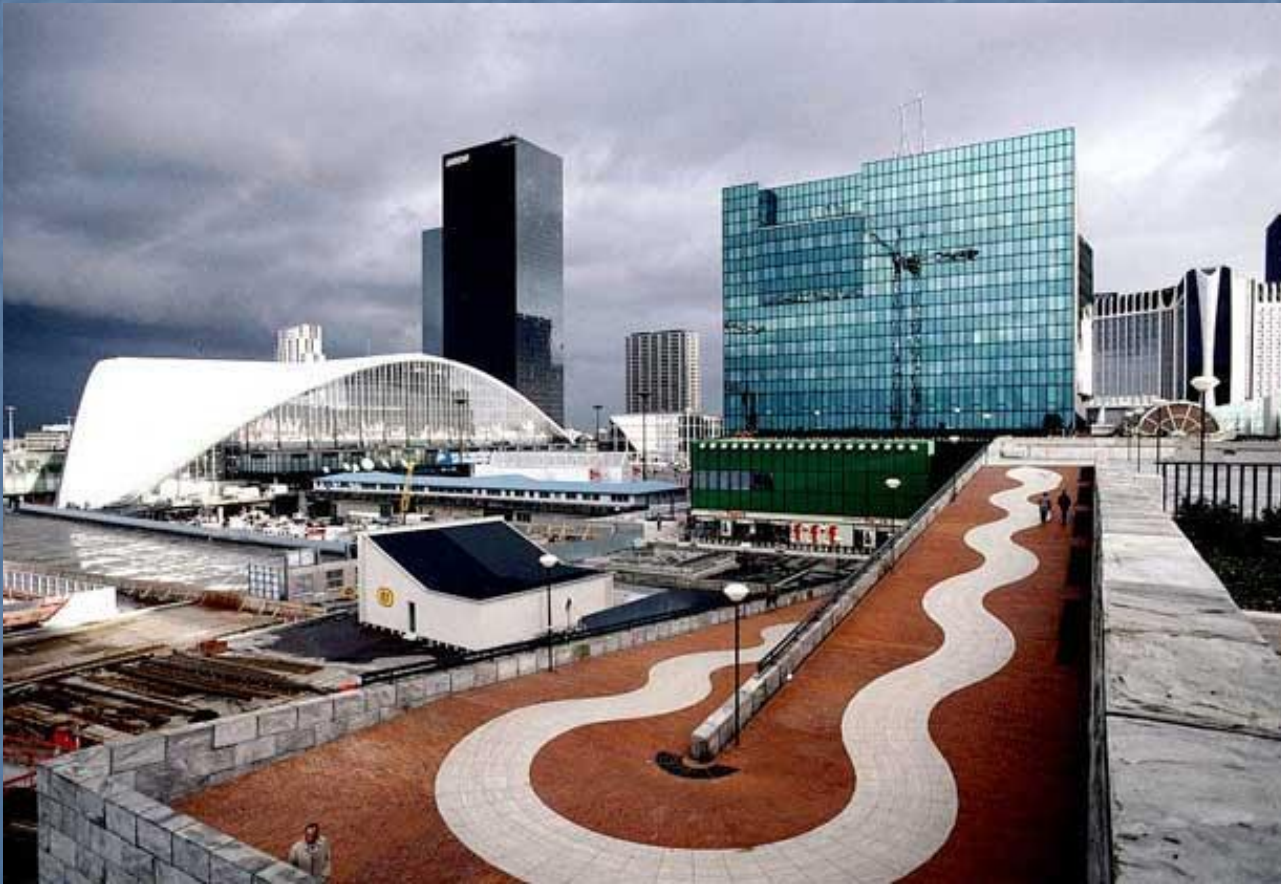
Дефанс, деловой и торговый район в северо-западной части Парижа.