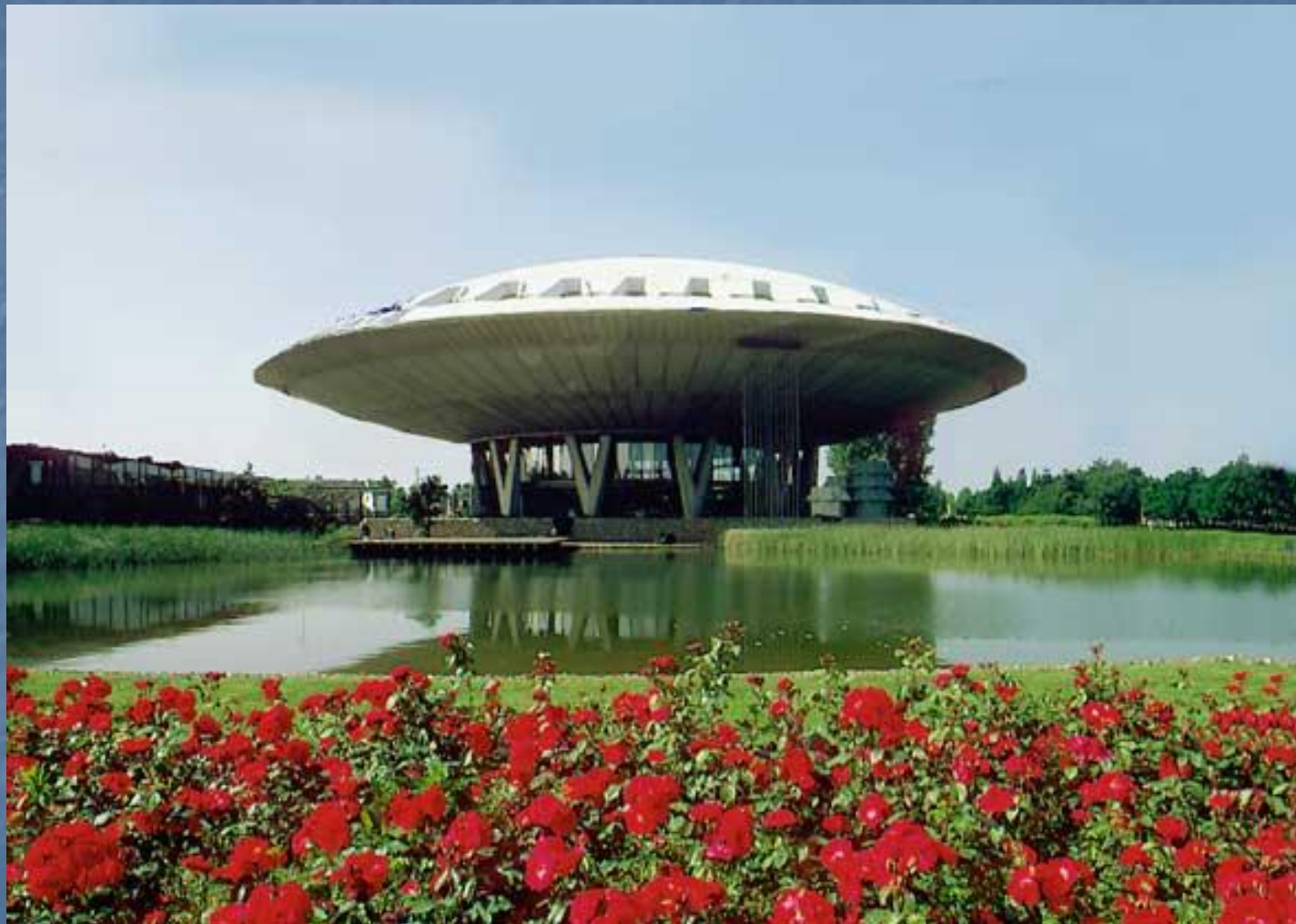
Выставочный центр концерна «Филипс».