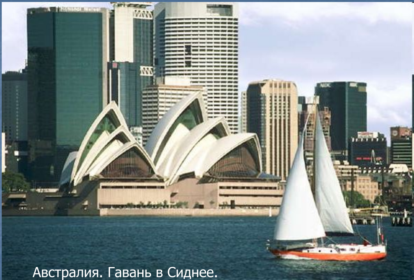
Австралия. Гавань в Сиднее. Вид на оперный театр — один из символов города.