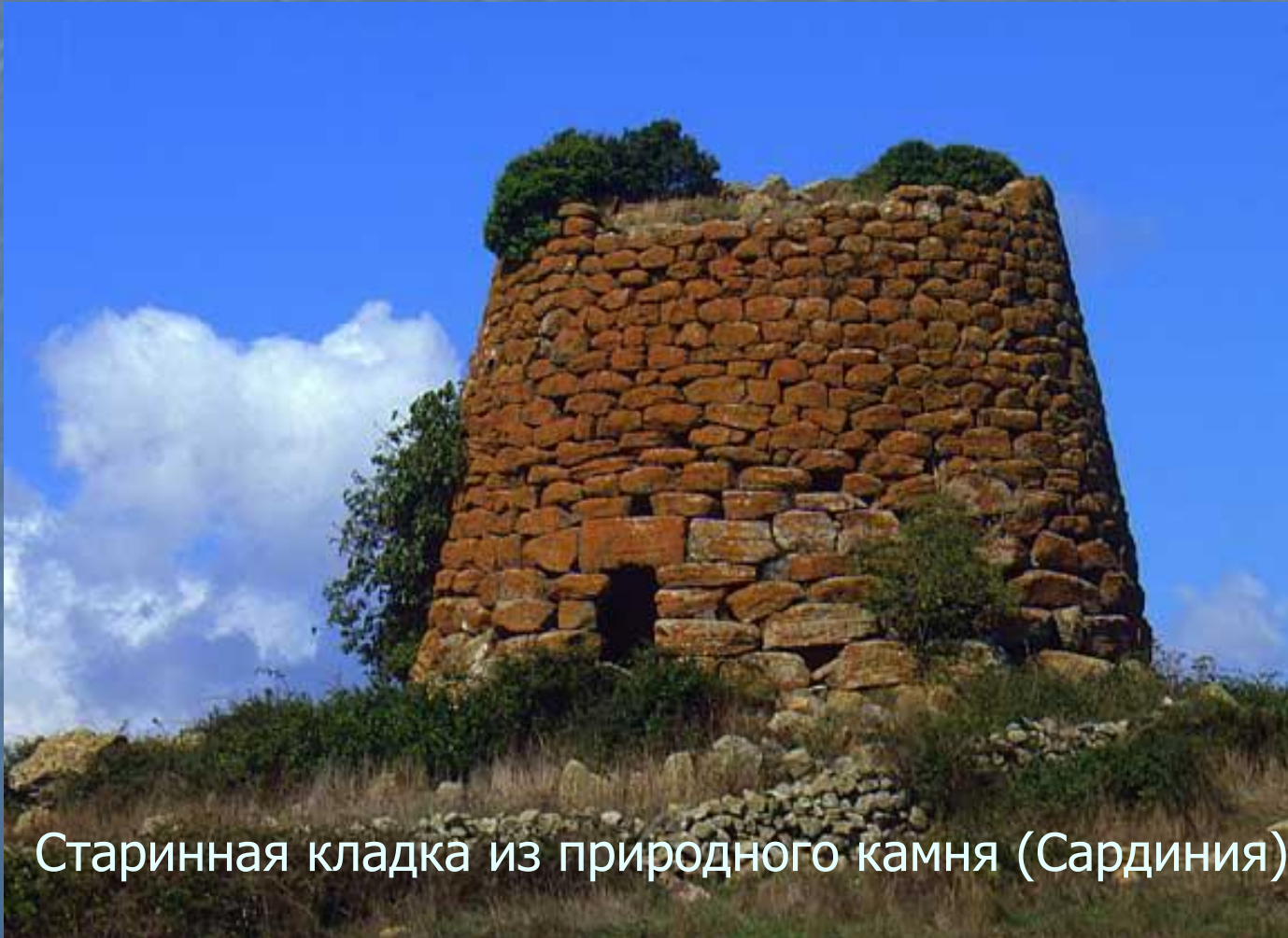
Старинная кладка из природного камня (Сардиния).