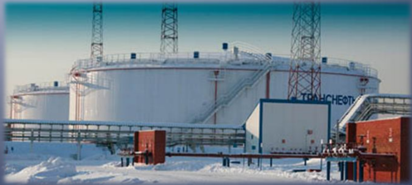
Округ сегодня первый в России по добыче нефти.