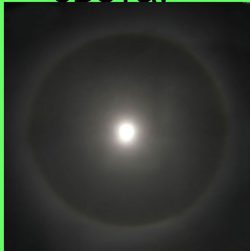
Гало вокруг Луны

Гало́ (от греч. Χαλοσ (халос) — «круг» или «диск»; также а́ура, нимб, орео́л) Это оптический феномен, светящееся кольцо вокруг объекта — источника света.