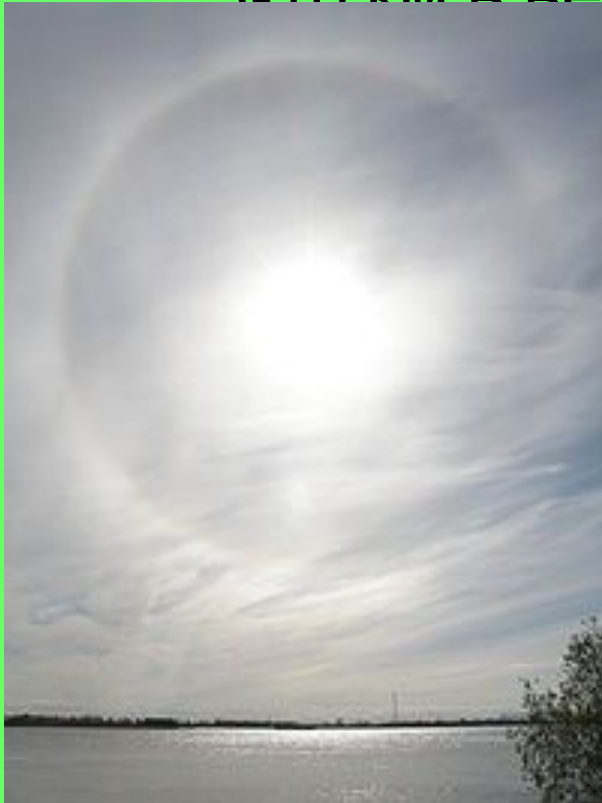
Солнечное гало над Архангельском

Существует множество типов гало, но вызваны они преломлением света ледяными кристаллами в перистых облаках на высоте 5-10 км в верхних слоях тропосферы.