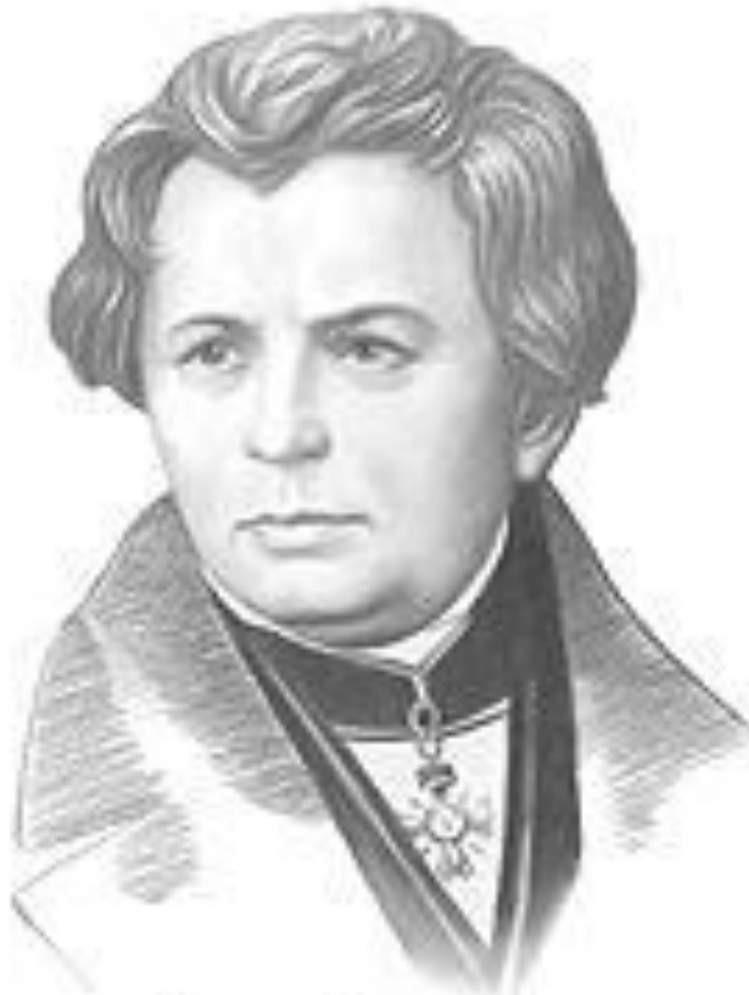
Георг Симон Ом 1787—1854