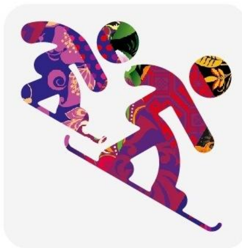
Сноуборд - кросс