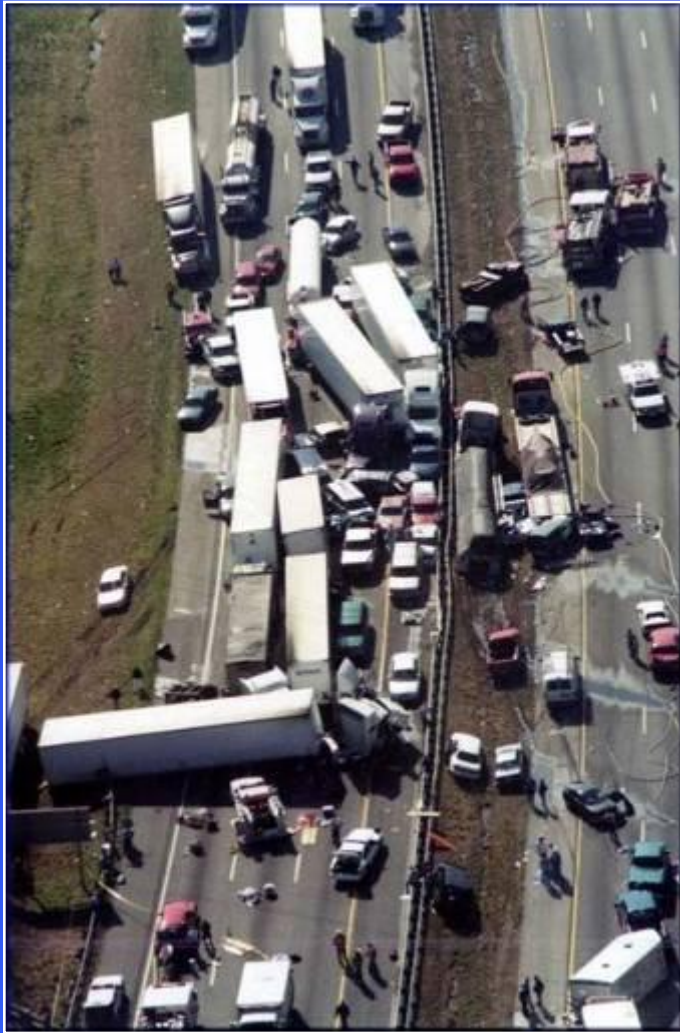
Крупная авария в США.

Инфразвук- «создают» к сожалению многие машины и промышленные установки. Люди из-за этого быстро утомляются, их охватывает беспокойство – это может быть причиной аварии. Ученые выяснили, что максимальная опасность для человека – это область 6-8 Гц. В некоторых источниках частота 7 Гц считается смертельной для человека при соответствующих уровнях звукового давления.