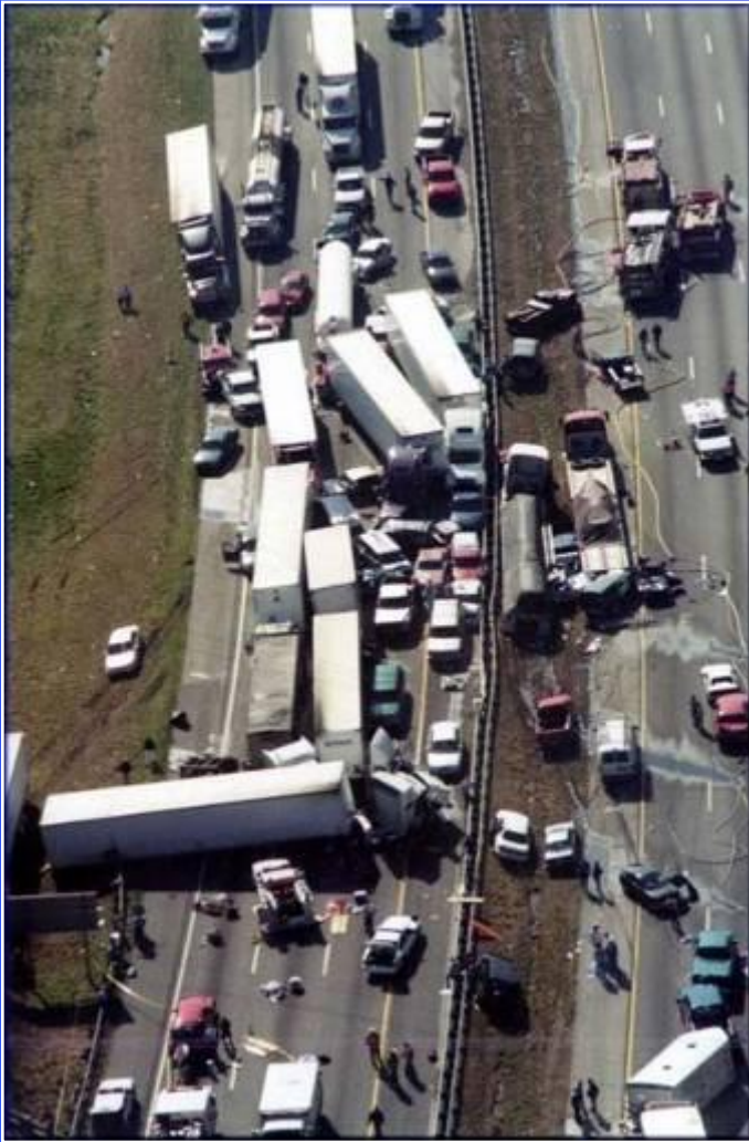
Крупная авария в США.

Инфразвук- «создают» к сожалению многие машины и промышленные установки. Люди из-за этого быстро утомляются, их охватывает беспокойство – это может быть причиной аварии. Ученые выяснили, что максимальная опасность для человека – это область 6-8 Гц. В некоторых источниках частота 7 Гц считается смертельной для человека при соответствующих уровнях звукового давления.