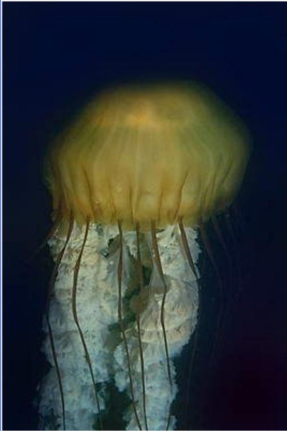
Медуза. Залив Монтеррей.

Различные морские жители способны воспринимать «голос моря»- медузы, ракообразные- задолго до наступления шторма чувствуют его приближение. Как же такое простое животное, как медуза, узнает за много часов о приближении шторма? Оказывается, у медузы есть инфраухо. Оно дает ей возможность улавливать недоступные слуху человека инфразвуковые колебания(частотой 8-13 Гц), которые хорошо распространяются в воде и появляются за 10-15 часов. Используя принцип действия «уха» медузы, сотрудники кафедры биофизики МГУ им. М.В. Ломоносова создали автоматический прибор-предсказатель бурь. С помощью этого прибора теперь можно узнавать о приближении шторма за 15 часов.