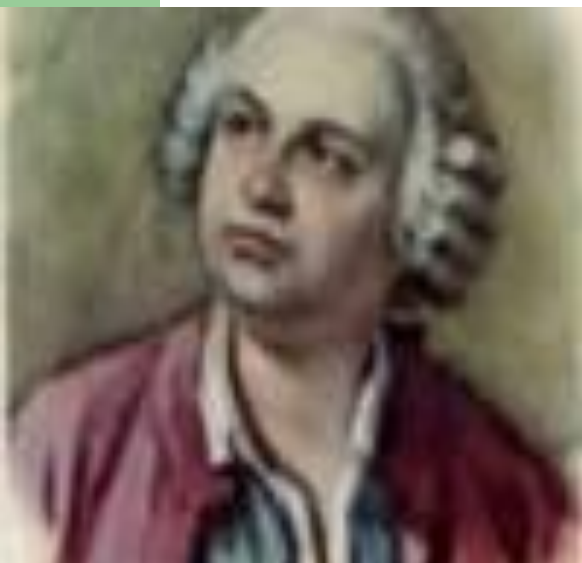
Михаил Васильевич Ломоносов