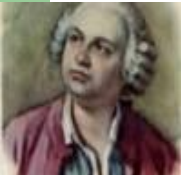
Михаил Васильевич Ломоносов