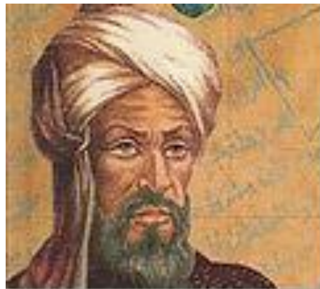
Мухаммед ибн Мусса ал- Хорезми