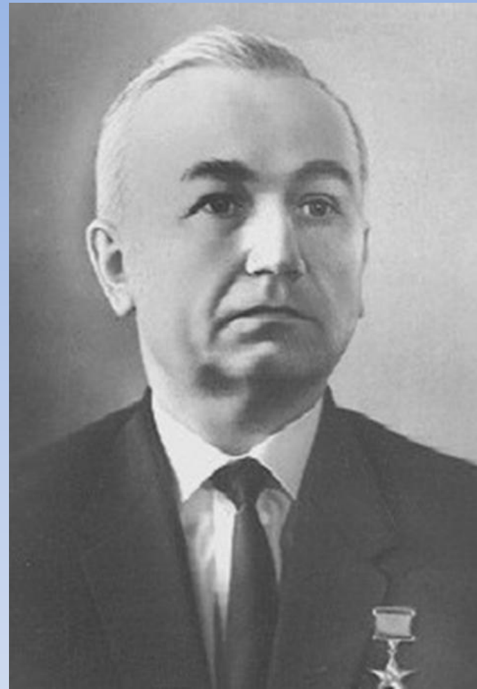
Л. Ф. Верещагин