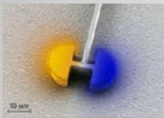
Резонансный контур лазера с двумя полукруглыми лазерами