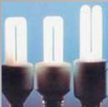
Светильники с разрядными лампами