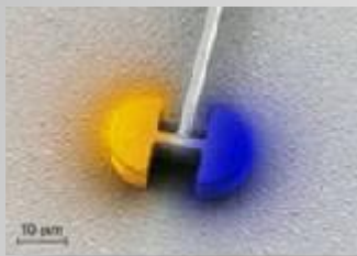
Резонансный контур лазера с двумя полукруглыми лазерами