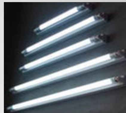
Лампа дневного света