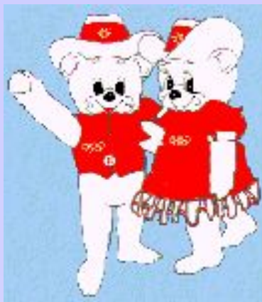
Хайди и Хоуди