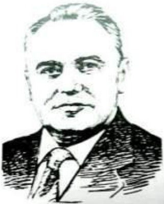
С. П. Королев