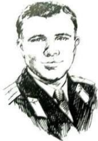
Ю. А. Гагарин

Самые большие достижения в области покорения космоса принадлежат нашей стране-России.