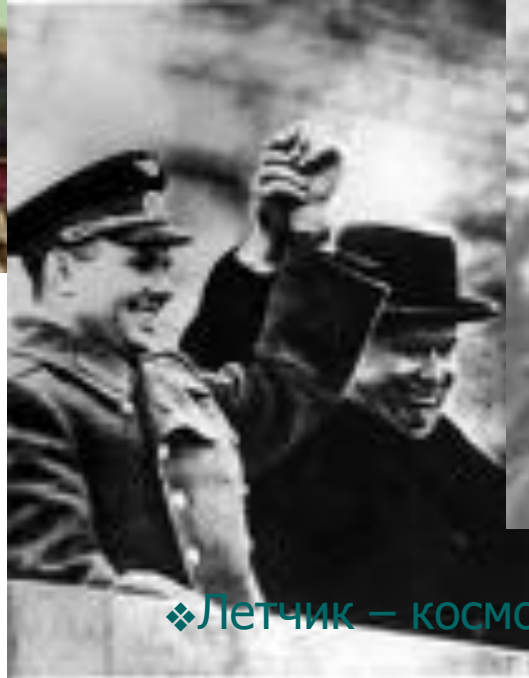
❖ Летчик – космонавт СССР Ю.А.Гагарин