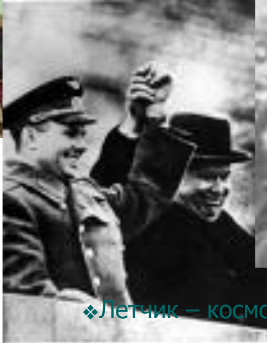
❖ Летчик – космонавт СССР Ю.А.Гагарин