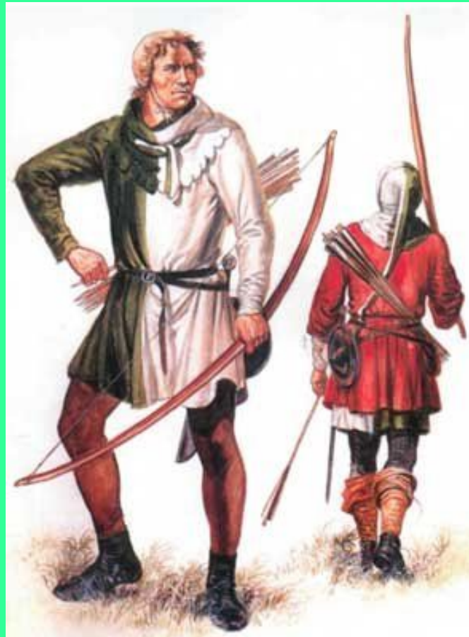
Стрельба из лука