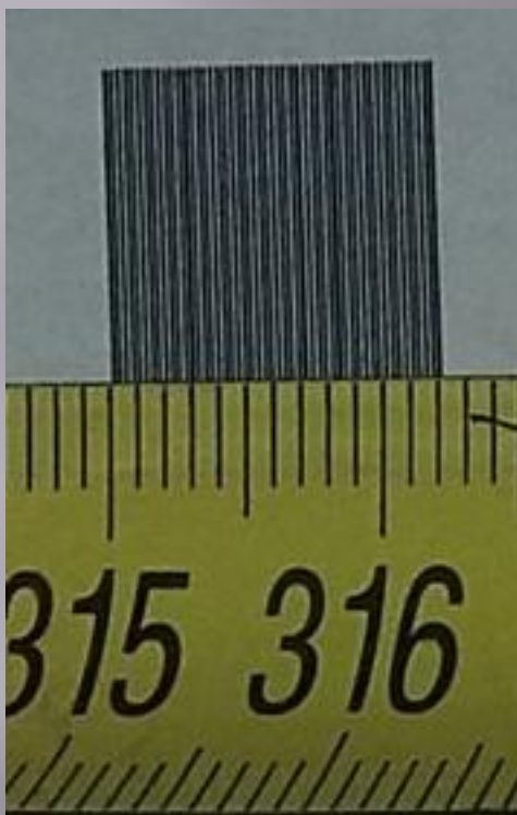
Рисунок 5 – Дифракционная решетка с периодом 0,5 мм.