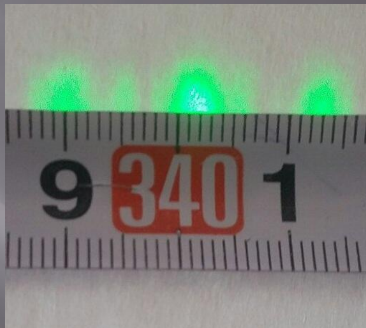
Рисунок 6 - Дифракционная картина, третий порядок видно на расстоянии 5, 15 м.