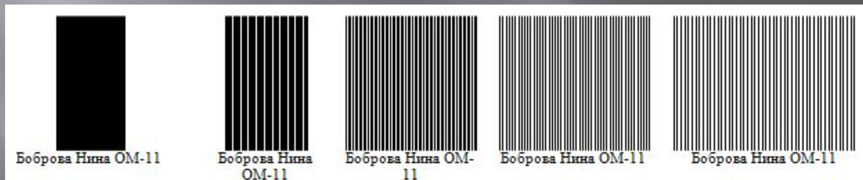
Рисунок 2. Изготовленные дифракционные элементы.