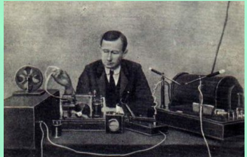
Г.Маркони у своей приёмопередающей станции

За границей усовершенствование подобных приборов проводилось фирмой, организованной итальянским инженером Г. Маркони. Опыты, поставленные в широком масштабе, позволили осуществить радиотелеграфную передачу через Атлантический океан.