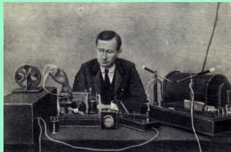
Г.Маркони у своей приёмопередающей станции

За границей усовершенствование подобных приборов проводилось фирмой, организованной итальянским инженером Г. Маркони. Опыты, поставленные в широком масштабе, позволили осуществить радиотелеграфную передачу через Атлантический океан.