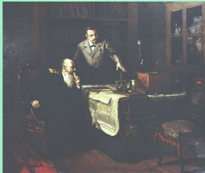
А. С. Попов демонстрирует действие своего прибора