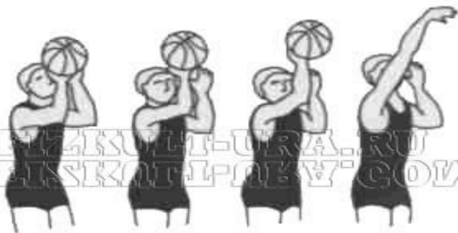
Бросок одной рукой от плеча