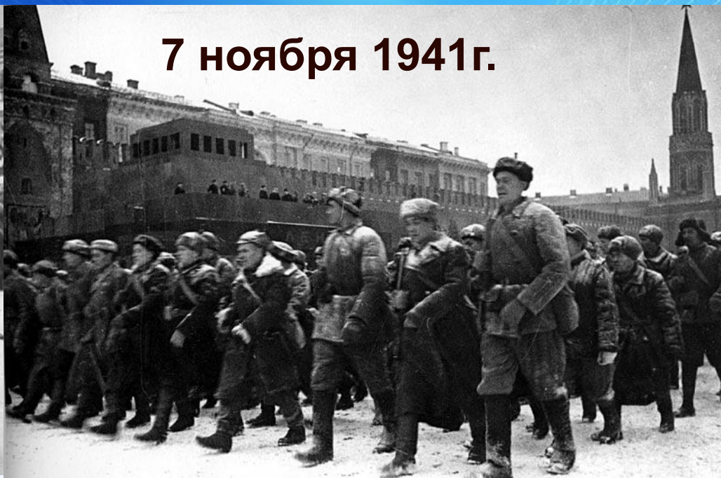
7 ноября 1941г.