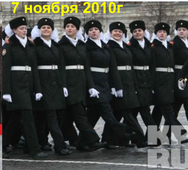
7 ноября 2010г.