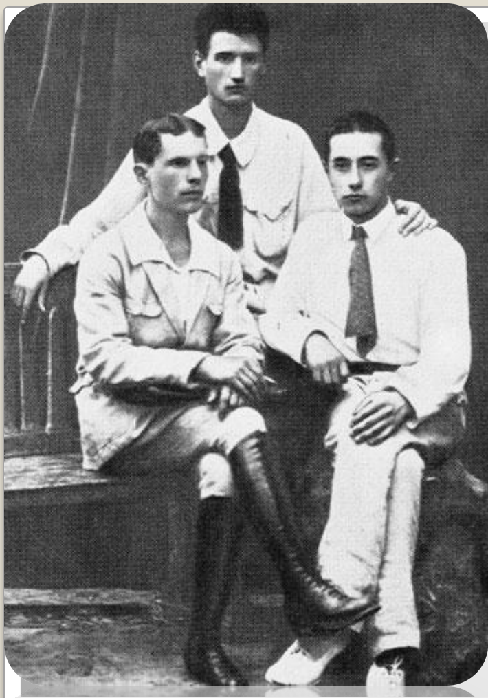
И. Курчатов (в центре) студент физико-математического факультета Таврического университета.