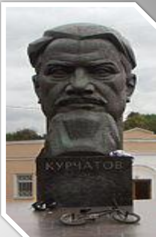
Памятник Игорю Курчатову на площади его имени в Москве.