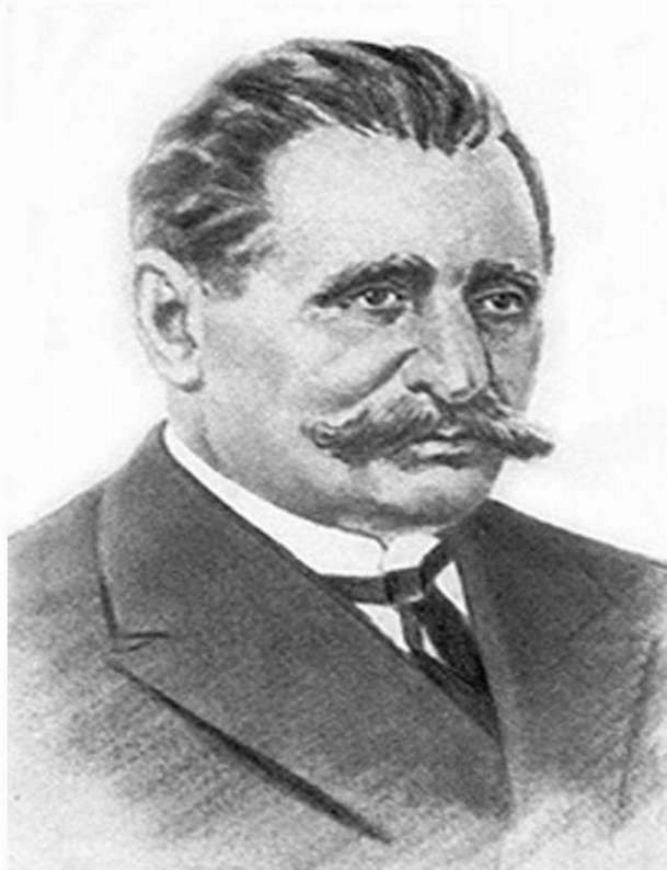
А.Н.Ладыгин – изобретатель электрической лампочки.

Первым создателем лампы был российский ученый, член Русского технического общества Александр Николаевич Ладыгин . Принцип накаливания был известен еще до Ладыгина – в этом смысле он ничего нового не открыл. Но несомненная заслуга Александра Николаевича состоит в том, что он первым сумел привлечь внимание широкой аудитории к построению источников света.