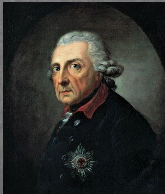
Фридрих II Прусский