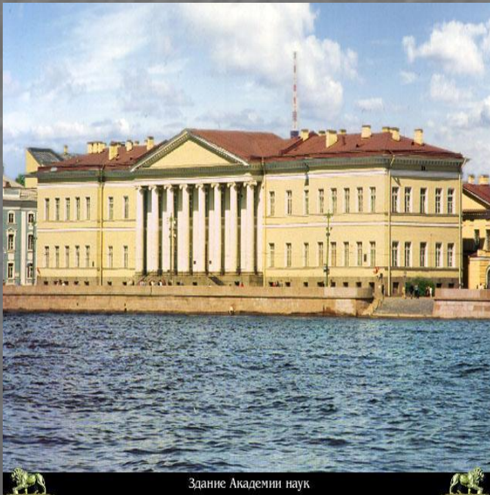
Здание Академии наук

В 1723г. Эйлер получил степень магистра искусств, в 1727г. защитил диссертацию о распространении звука.