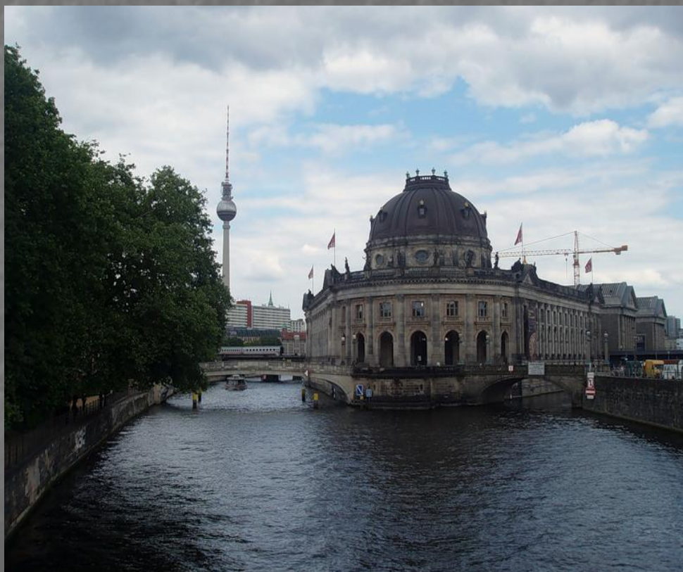
Берлинская академия наук

В 1741г. Эйлер по приглашению короля Пруссии Фридриха II переехал в Берлин.