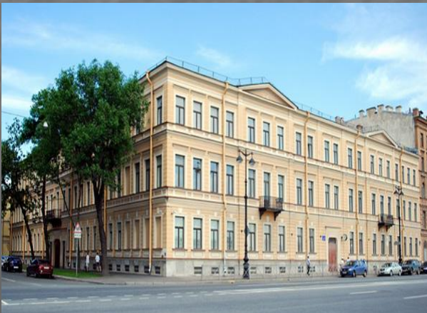
В этом доме жил Л. Эйлер в Петербурге

В 1766г. По приглашению Екатерины II Эйлер возвращается в Петербург и приступает к активной деятельности в Академии наук. В этот период он справедливо считается первым математиком в мире и пользуется всеобщим уважением и почётом.