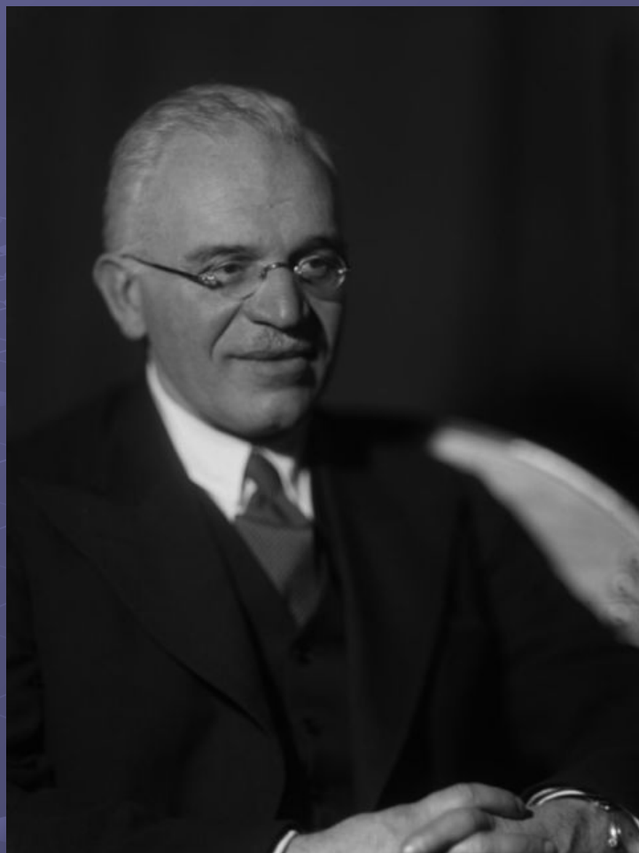
Николай Дмитриевич Папалекси