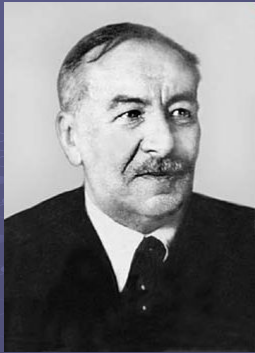
Леонид Исаакович Мандельштам