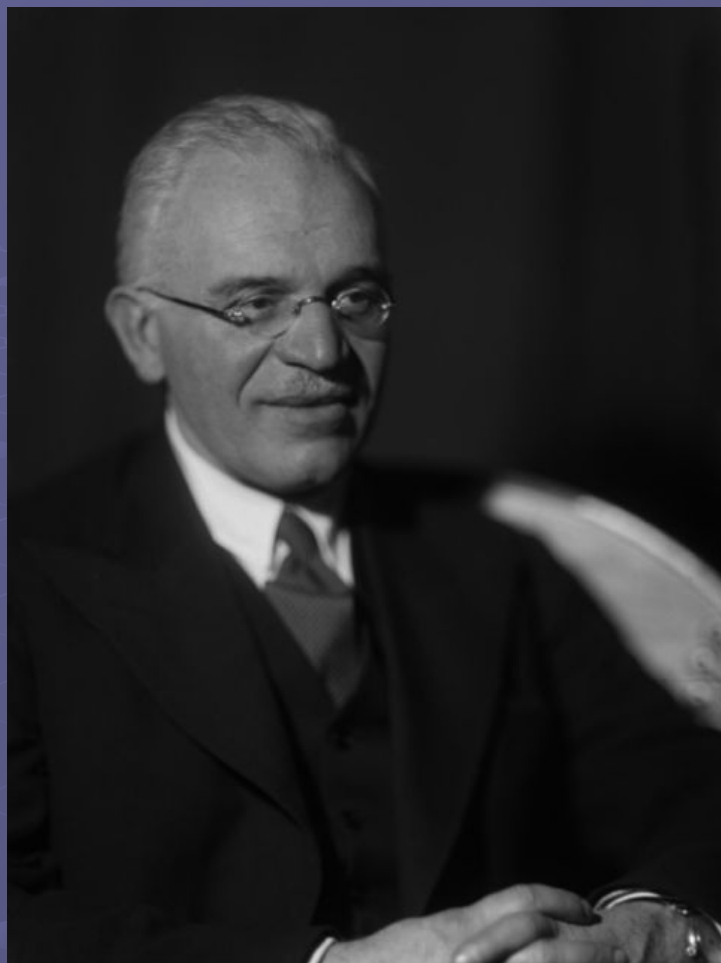
Николай Дмитриевич Папалекси