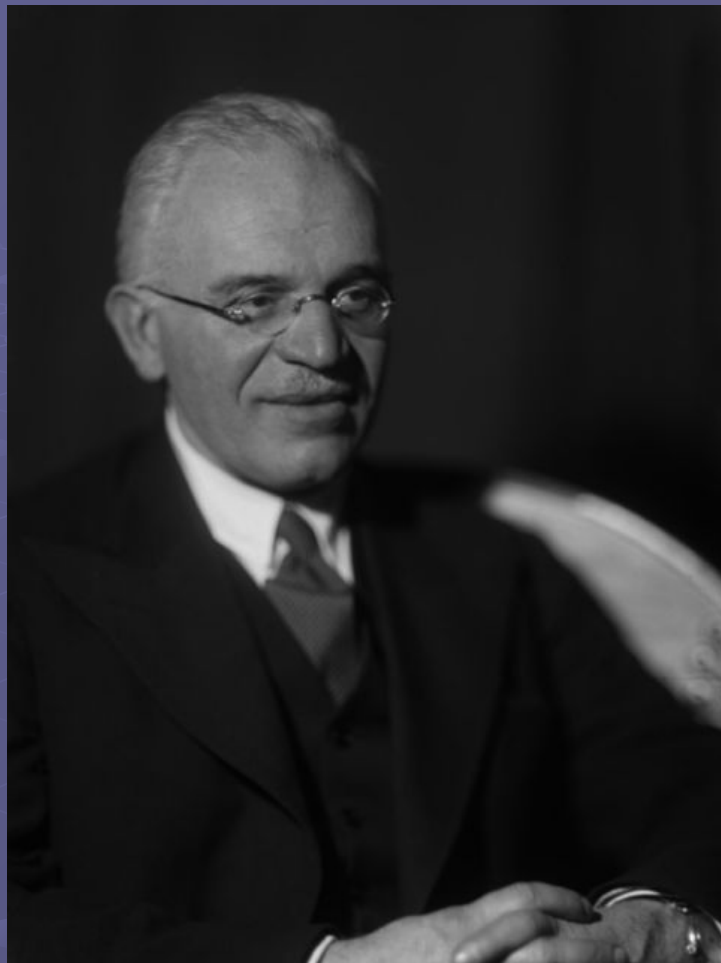
Николай Дмитриевич Папалекси