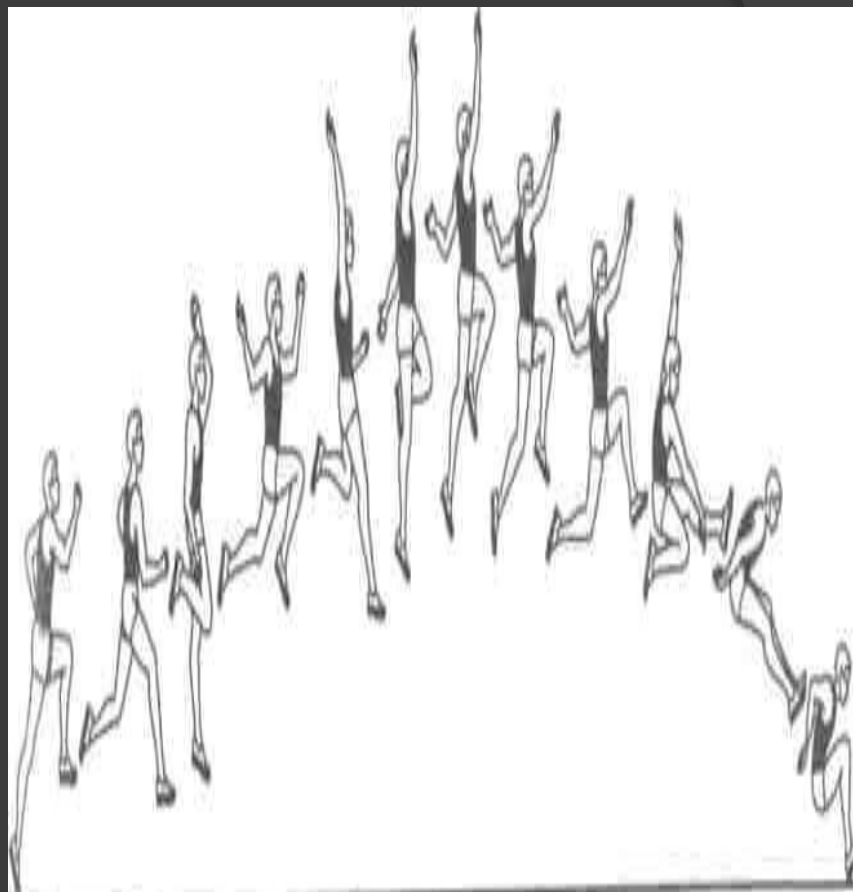
Прыжок в длину с разбега способом «ножницы»