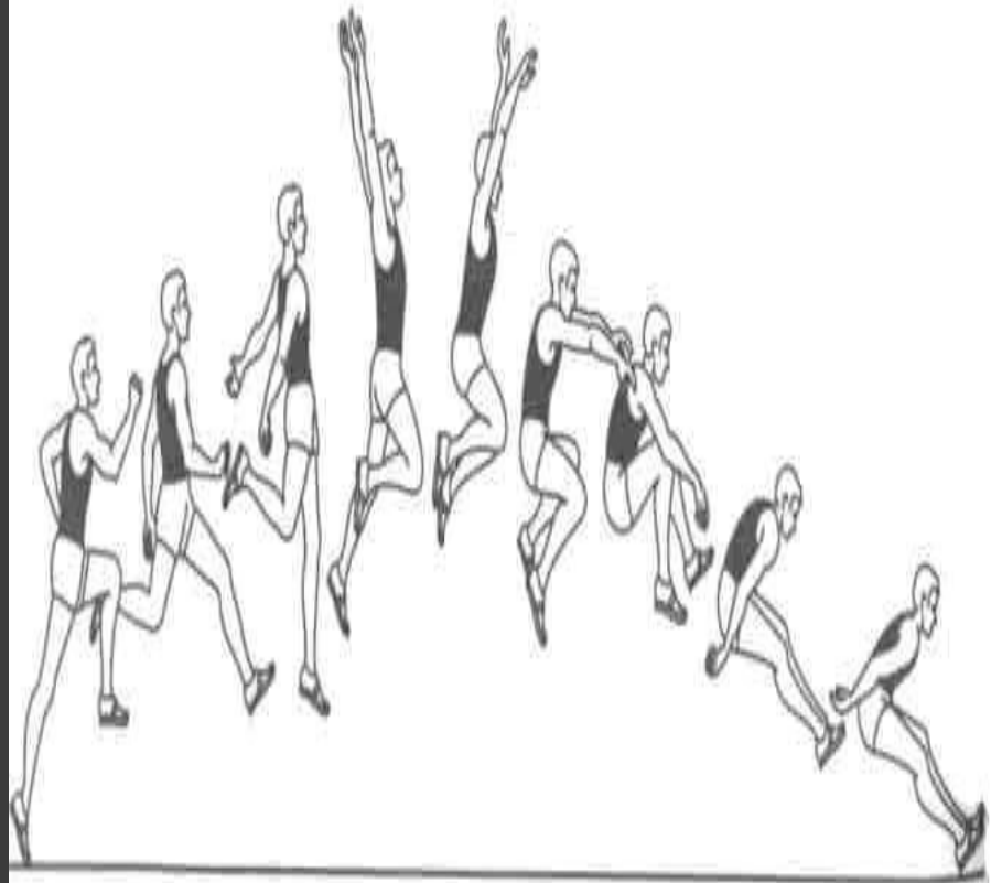
Прыжок в длину с разбега способом «прогнувшись»