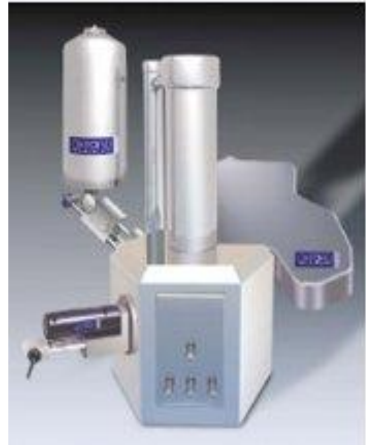
Микроанализаторы (Oxford instruments)

Рентгеновские спектрометры улавливают возникшее в образце рентгеновское излучение, а специальные приставки автоматически регистрируют интенсивность линий и все параметры процесса.