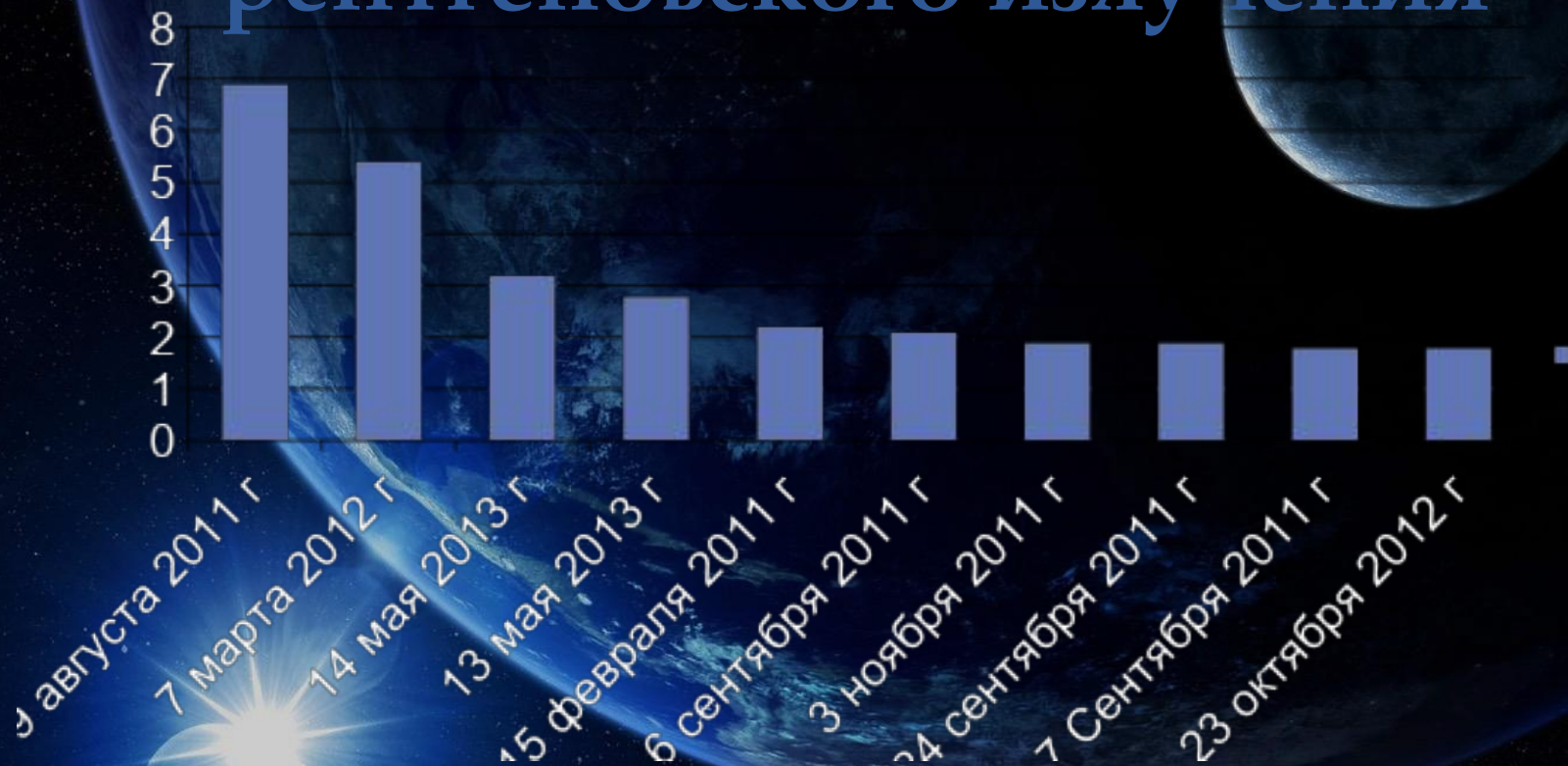
Диаграмма солнечных вспышек по пиковой мощности рентгеновского излучения

Данная диаграмма показывает, что самая мощная солнечная вспышка произошла 9 августа 2011 года