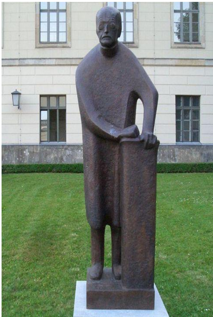
Рис.2 Памятник Макс Планку работы Бернхарда Хайлигера во дворе Берлинского университета.