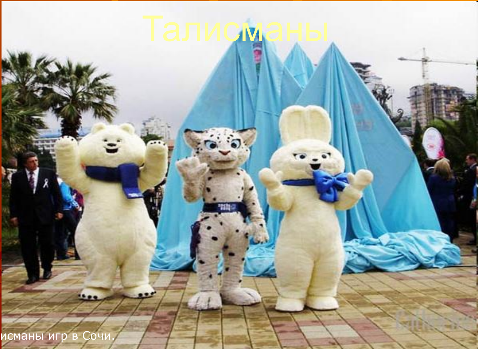
Талисманы игр в Сочи.