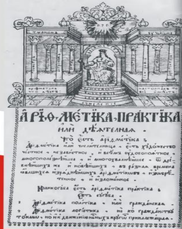
Страница из учебника по математике “Считание удобное, которым всякий человек купующий или продающий, зело удобно изыскати может, число всякие вещи”, 1714 г.