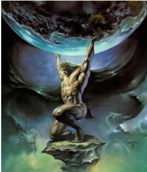
Атлант, Борис Валледжо, 1988 г.

Если на тело действует сила, но оно при этом не движется, то механическая работа также не совершается.