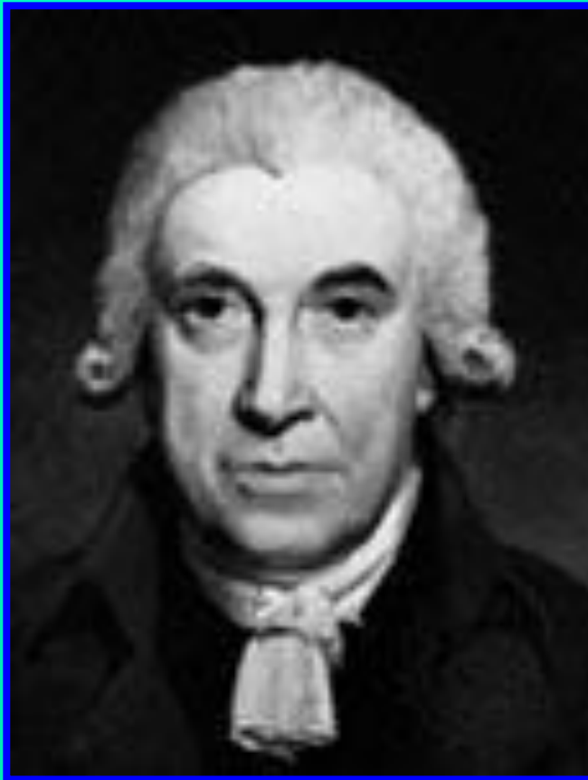
Уатт Джеймс (1736-1819) шотландский инженер и изобретатель