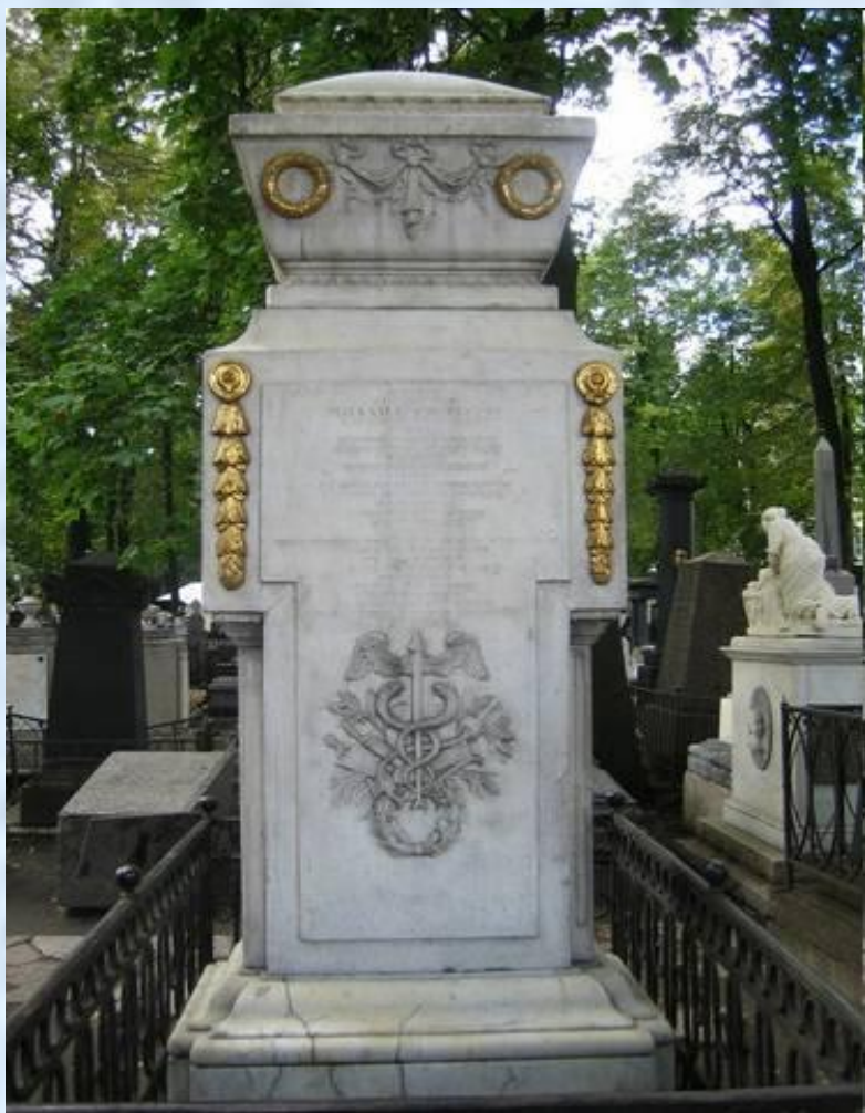
Могила М.В.Ломоносова в Александро-Невской лавре

Умер Ломоносов в Петербурге 4 апреля 1765.