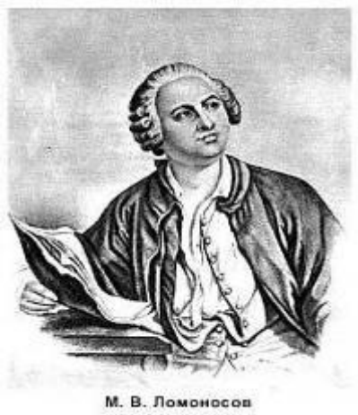
М. В. Ломоносов

Невод рыбак расстилал по брегу студёного моря; Мальчик отцу помогал. Отрок, оставь рыбака! Мрежи иные тебя ожидают, Иные заботы: Будешь умы уловлять, будешь помощник царям!