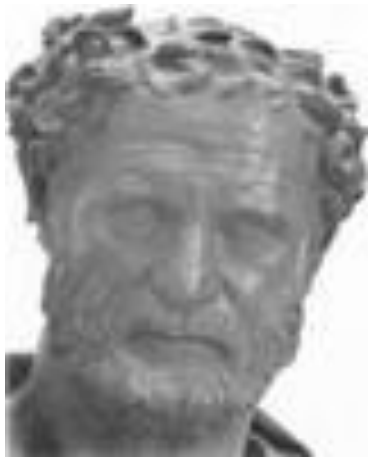
Греческий ученый Демокрит (460 – 370 г. до н.э.)