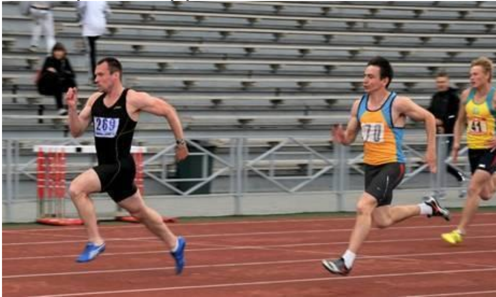
Бег на дистанцию 100 м

Человек при нормальных условиях работы развивает мощность 70-80 Вт. В течение очень короткого времени, например при беге на короткую дистанцию, прыжках, человек может развивать мощность до 2000 Вт.