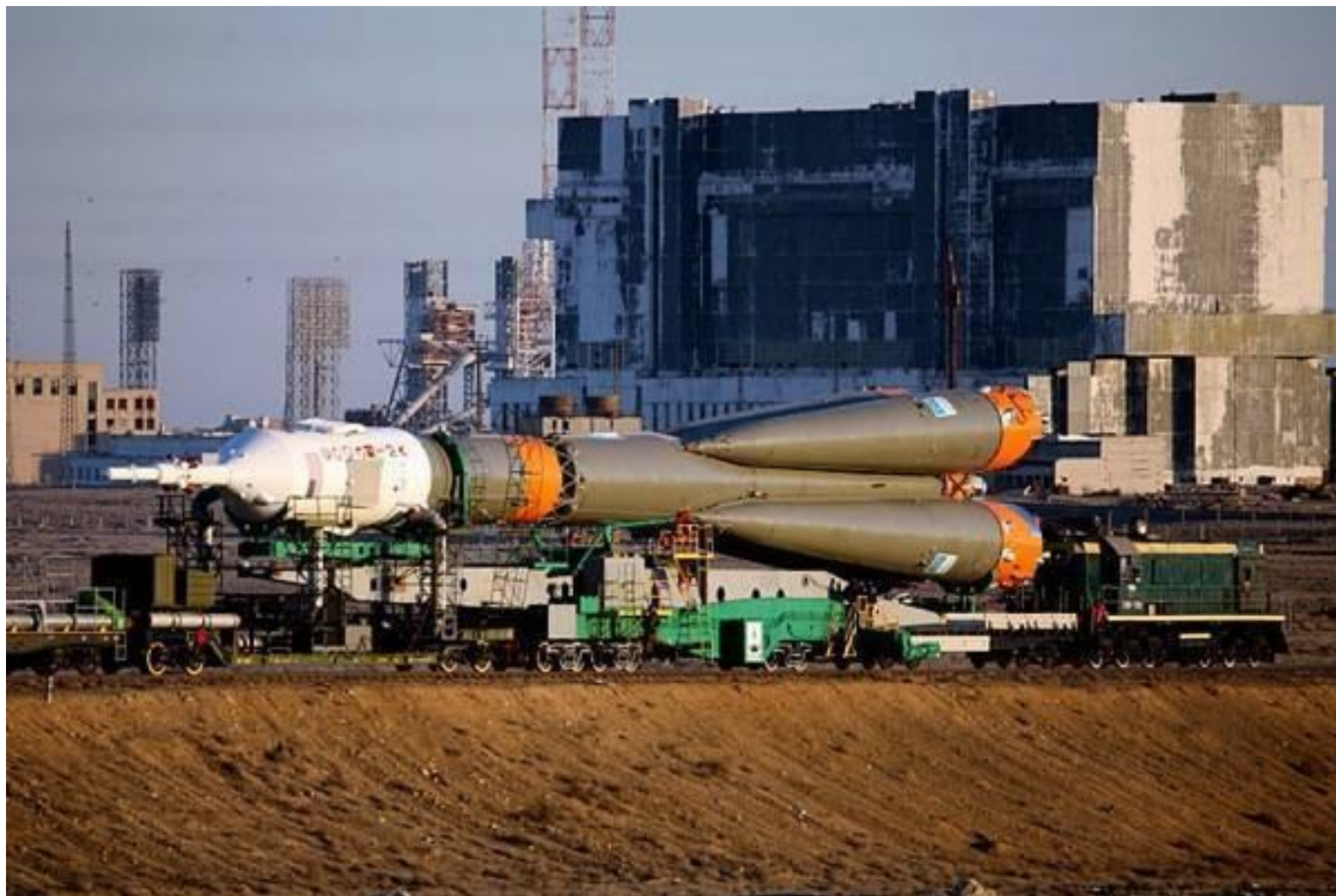
Космический корабль «Союз», Байконур, 2009 г.

Мощность двигателя ракеты-носителя космического корабля – 15000 МВт.