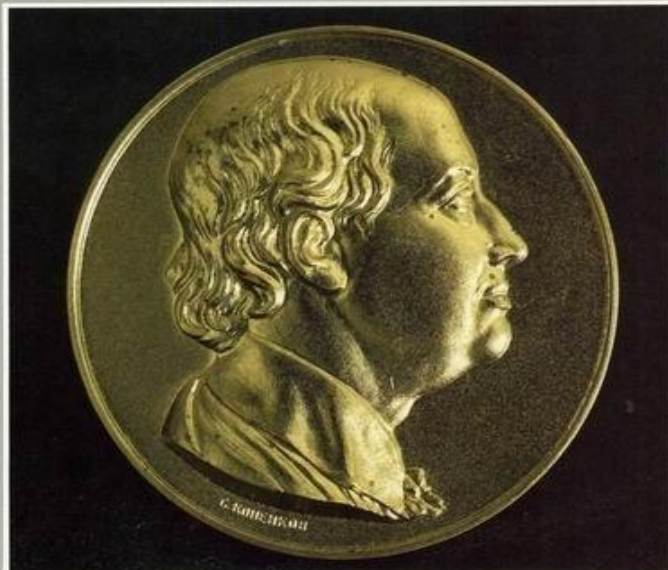
Медаль им. М.В.Ломоносова Академии наук СССР