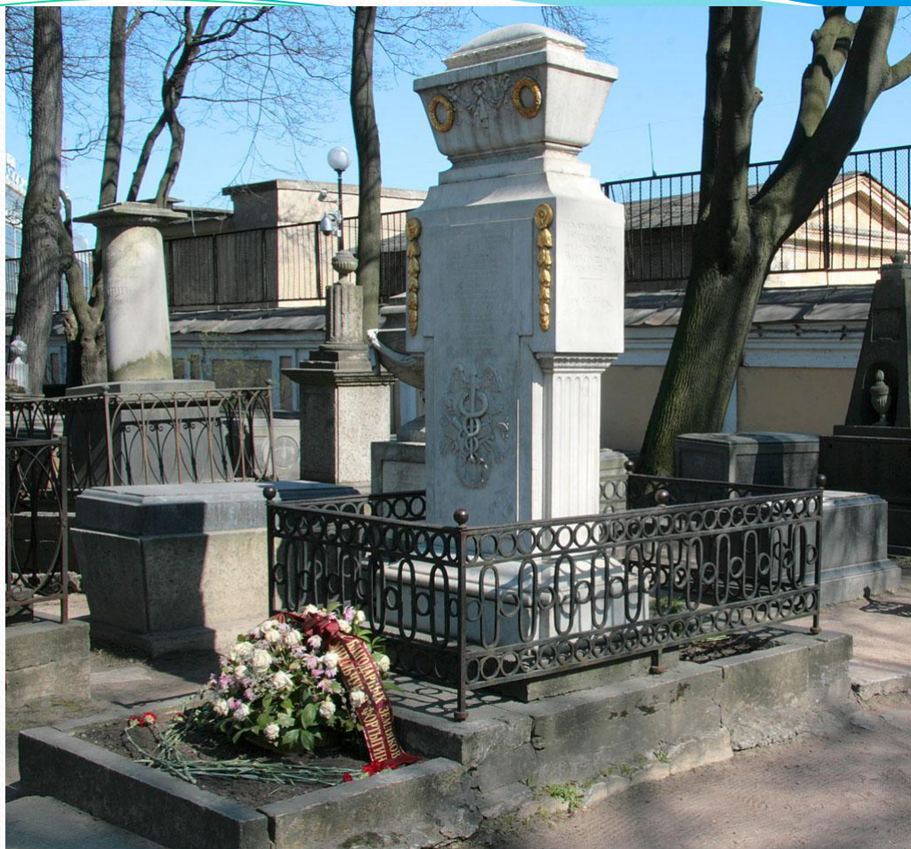
Михаил Васильевич Ломоносов похоронен на Лазаревском кладбище около Александро-Невской лавры.