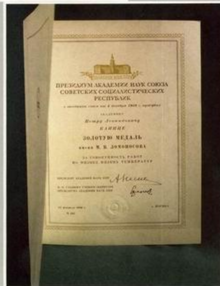
Диплом за работу по физике им. М.В.Ломоносова П.Л.Капицы

В 1956 году постановлением Совета Министров СССР была учреждена золотая медаль и премия имени М.В.Ломоносова.