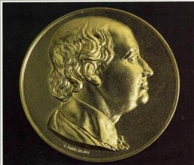
Медаль им. М.В.Ломоносова Академии наук СССР