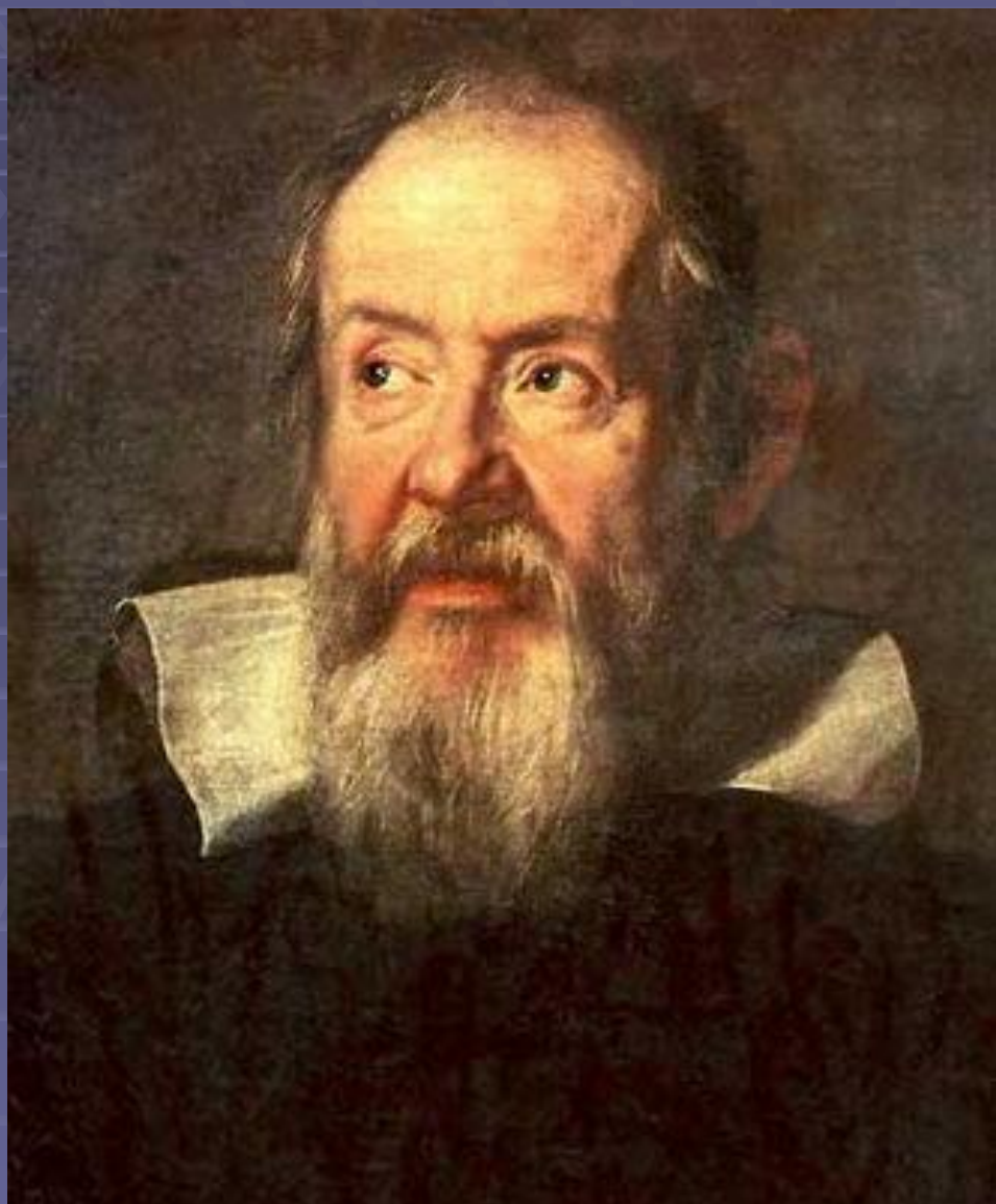
Галилео Галилей (1564 – 1642)