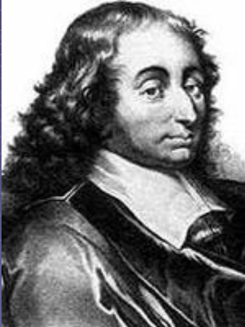
Блез Паскаль (1623 – 1662)