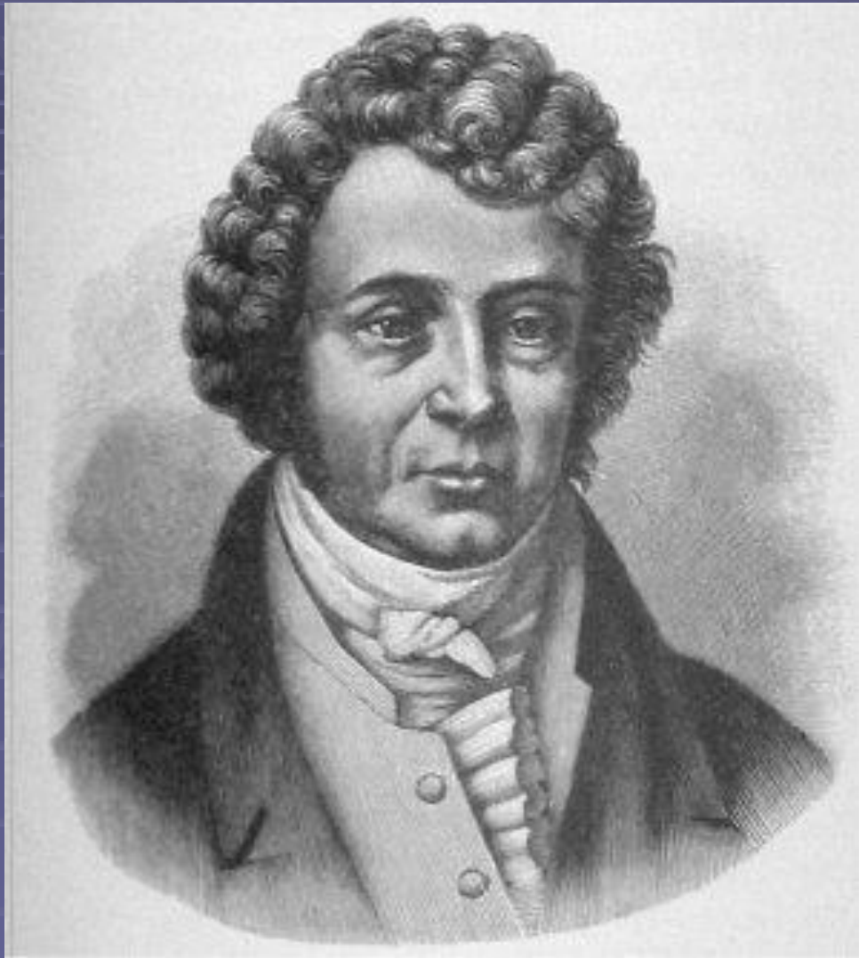
Андре Мари Ампер (1775 - 1836)