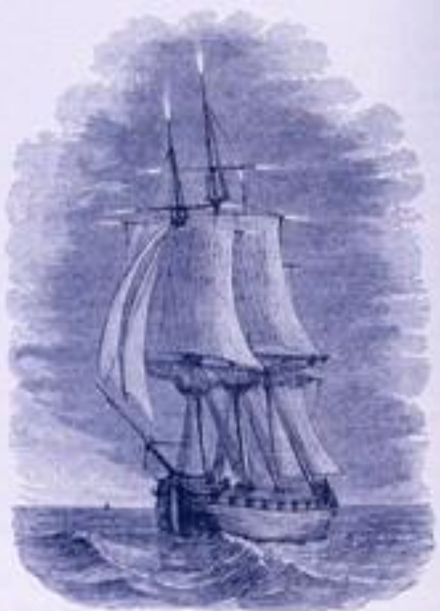
THE SHIP'S BARK OR BATTLE OF 1611

Свое название, это свечение получило от церкви Святого Эльма, которая находилась в Италии. Эта церковь была известна далеко за пределами Италии, поскольку время от времени прямо перед грозой, крест на шпигеле этой церкви начинал светиться и пылать голубоватым огнём, словно факел. Иногда огни загорались и на шпилях боковых башен. В Древней Греции это явление называлось "огнями Кастора и Поллукса" - по имени мифических братьев-близнецов, которым Зевс дал бессмертие, превратив их в две самые яркие звезды в созвездии Близнецов.