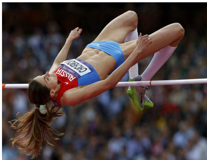
Анна Чичерова - прыжки в высоту