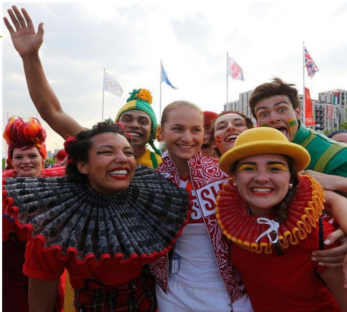
Россияне в Олимпийской деревне