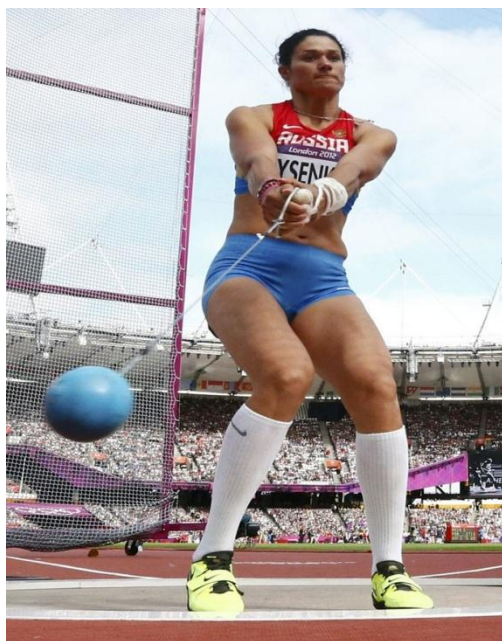
Татьяна Лысенко - метание молота