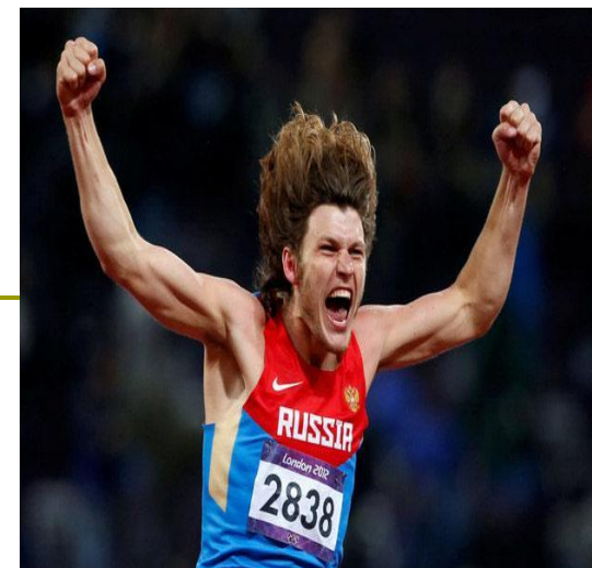
Иван Ухов - прыжки в высоту