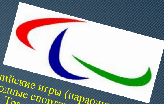
Эмблема параолимпийских игр

Параолимпийские игры (параолимпийские игры) — международные спортивные соревнования для инвалидов. Традиционно проводятся после главных Олимпийских игр, а начиная с 1992 — в тех же городах; в 2001 эта практика закреплена соглашением между МОК и Международным паралимпийским комитетом (МПК). Летние паралимпийские игры проводятся с 1960, а зимние паралимпийские игры — с 1976.