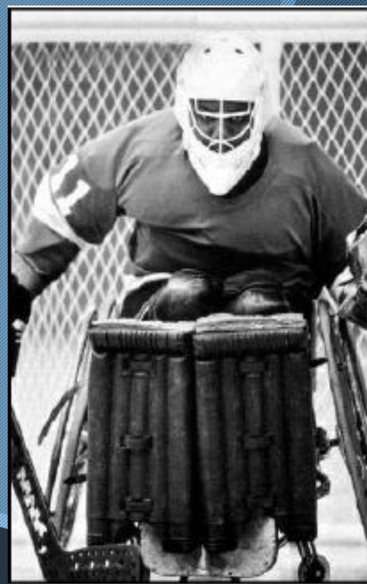
Людвиг Гуттман ( 3 июля 1899 — 18 марта 1980) „ Отец Паралимпийские игры “