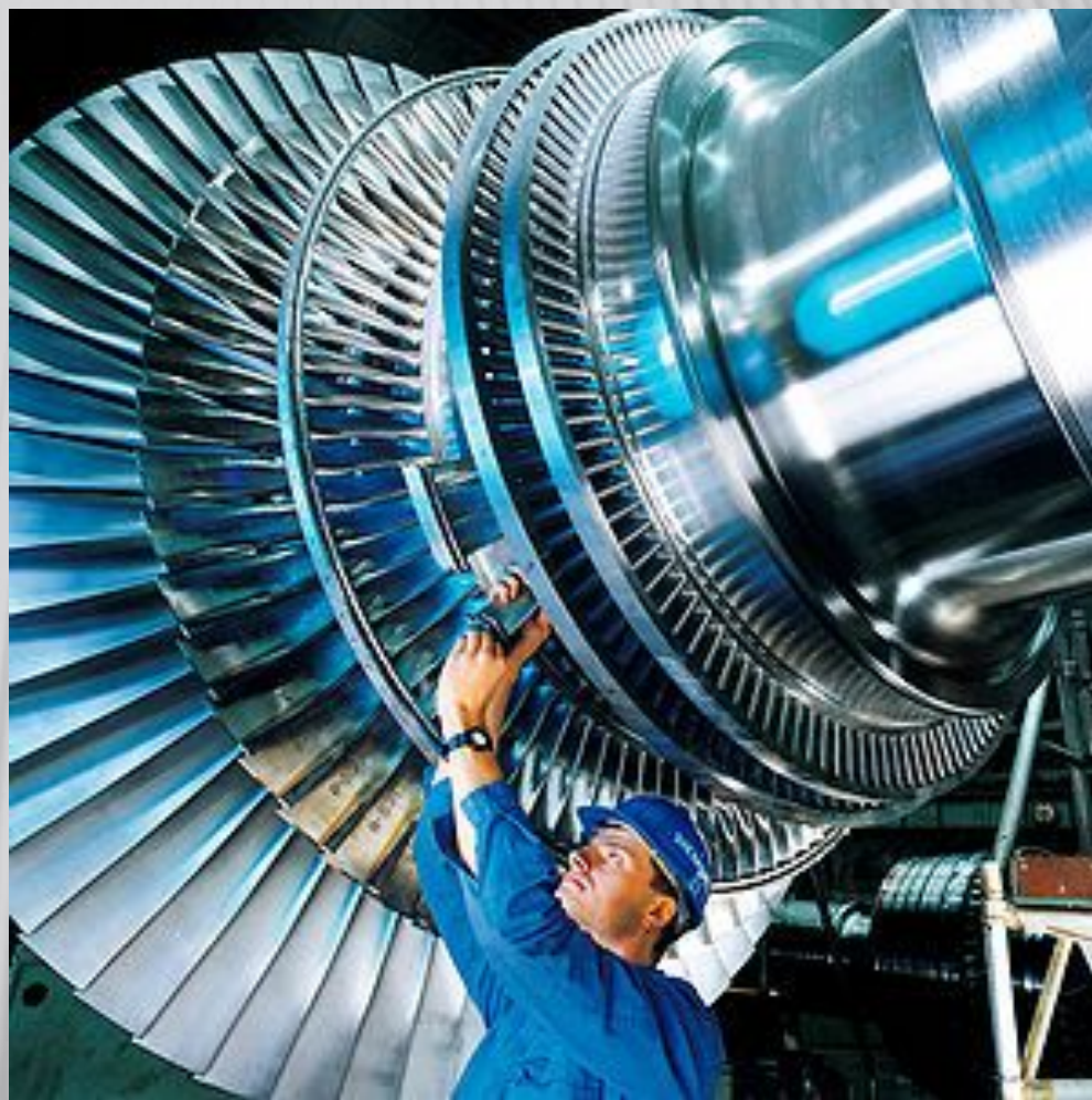
Монтаж паровой турбины, произведённой Siemens , Германия

Турбина (фр. turbine от лат. turbo вихрь, вращение ) — двигатель с вращательным движением рабочего органа (ротора), преобразующий потенциальную энергию, кинетическую энергию, внутреннюю энергию рабочего тела, пара, газа, воды, в механическую работу. Струя рабочего тела воздействует на лопатки, закреплённые по окружности ротора, и приводит их в движение.