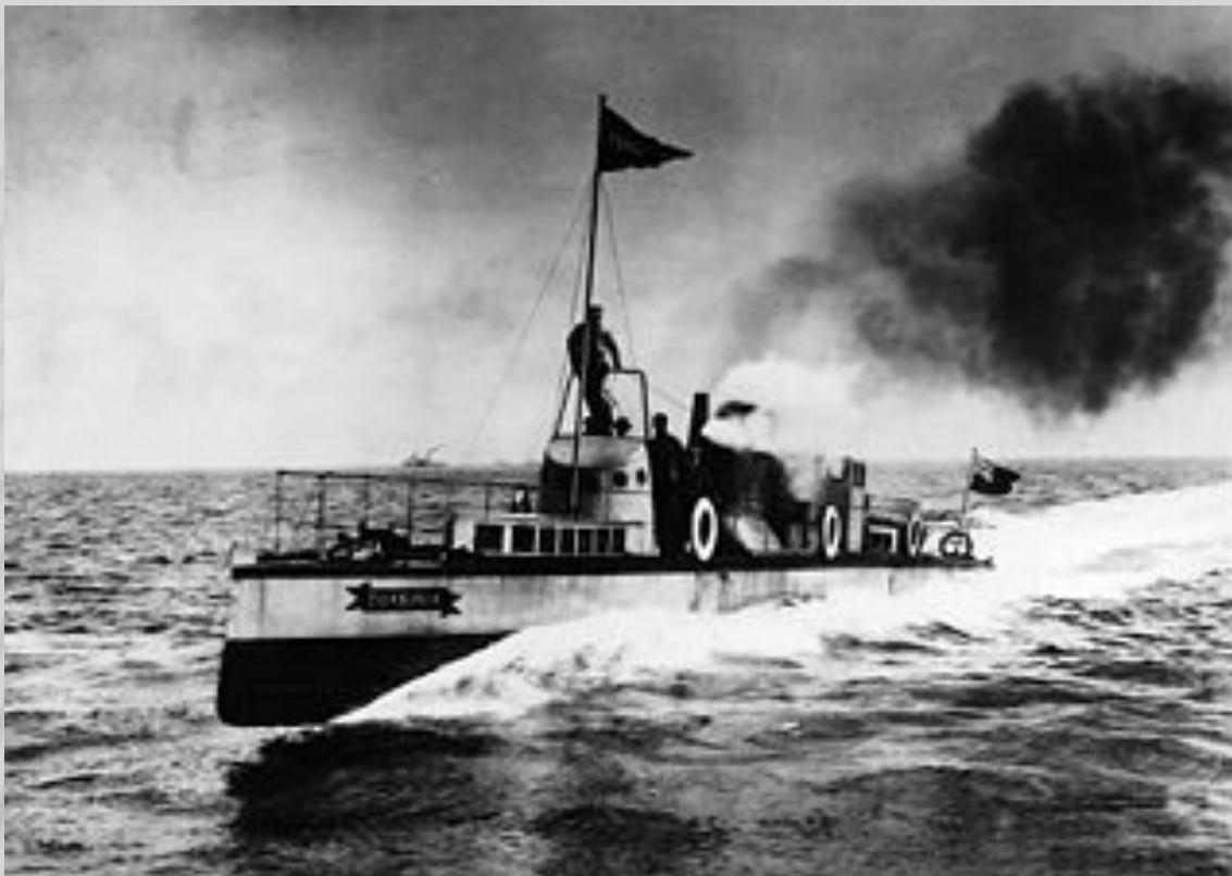
«TURBINIA» — опытное судно Чарлза Парсонса