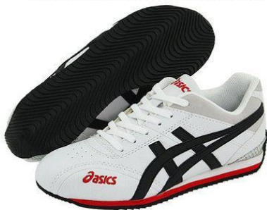
Кроссовки или спортивные тапочки