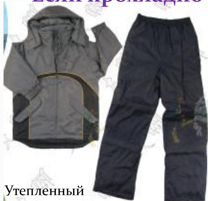
Утепленный ветрозащитный костюм