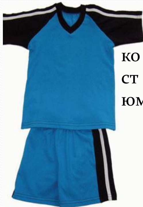
КО СТ ЮМ