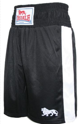
Шорты или велосипедки