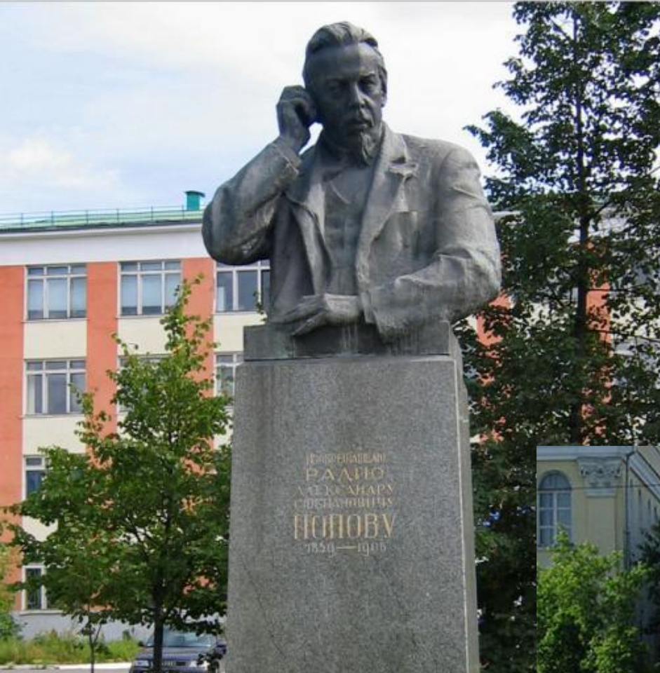
Памятник А.С. Попову в сквере его имени в Екатеринбурге