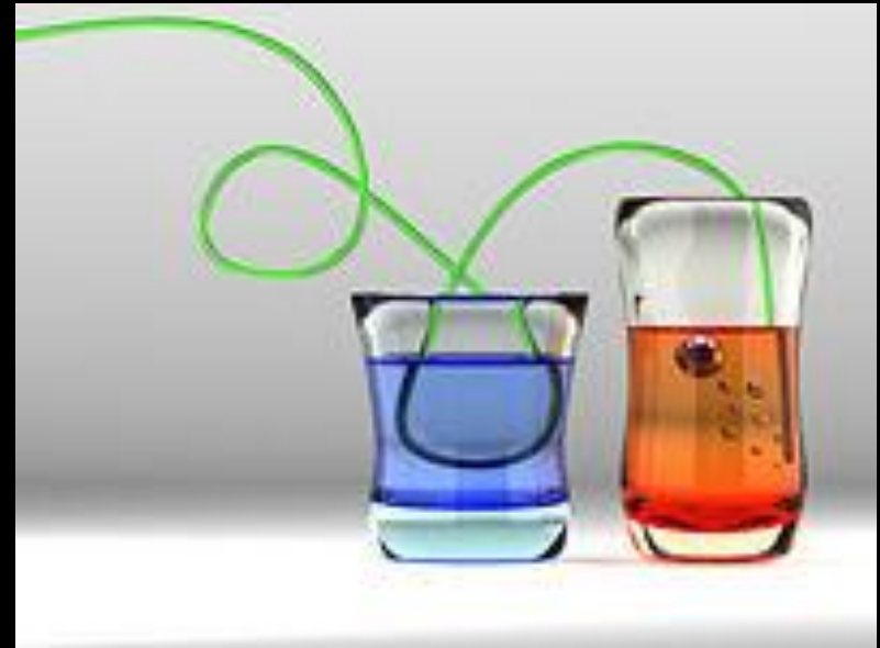
Преломление света в разных жидкостях и стекле