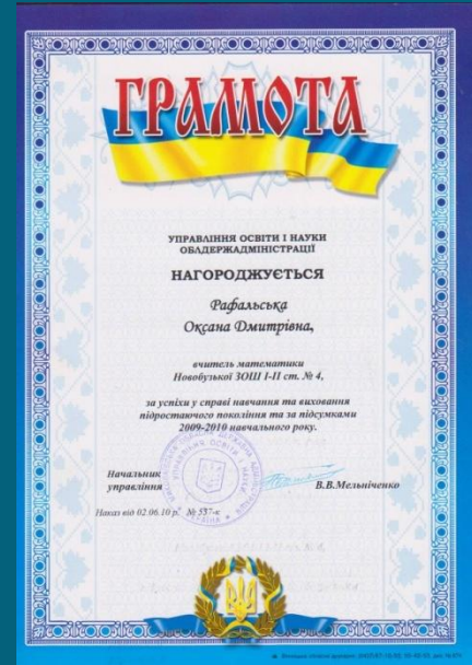
Грамота обласного управління освіти 2010 р