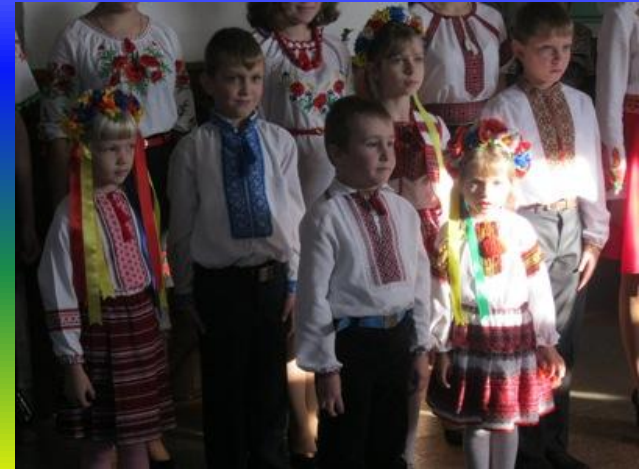
До дня захисника України