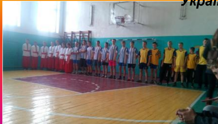
Проведення козацьких забав