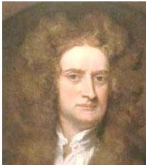
Исаак Ньютон (1642-1727)

В Англии жил великий ученый Ньютон. Однажды осенью гуляя по саду он увидел как с ветки упало яблоко. Он первым понял, что яблоко притянула Земля. Так был открыт закон всемирного тяготения.