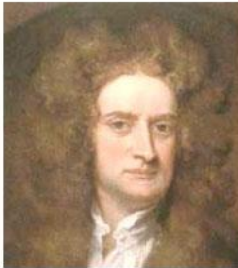
Исаак Ньютон (1642-1727)

В Англии жил великий ученый Ньютон. Однажды осенью гуляя по саду он увидел как с ветки упало яблоко. Он первым понял, что яблоко притянула Земля. Так был открыт закон всемирного тяготения.