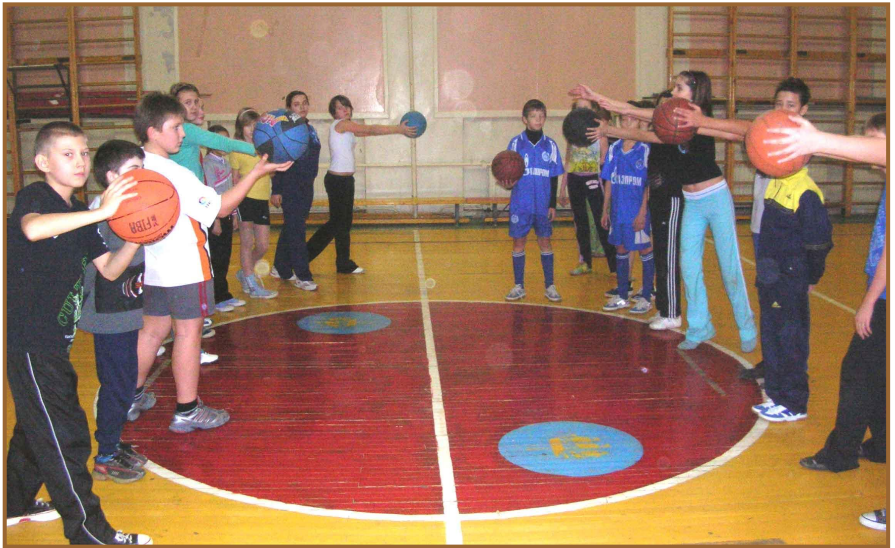
Игра «Очисти свой сад от камней»